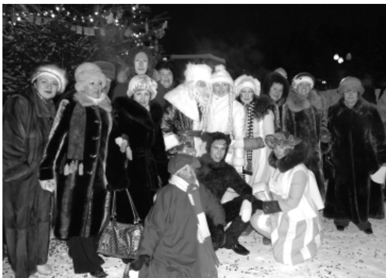
Накануне праздника на площади возле главного корпуса БрГУ состоялось торжественное открытие новогодней Елки, которая из года в год радует не только тех, кто учится и работает в вузе, но и всех горожан.