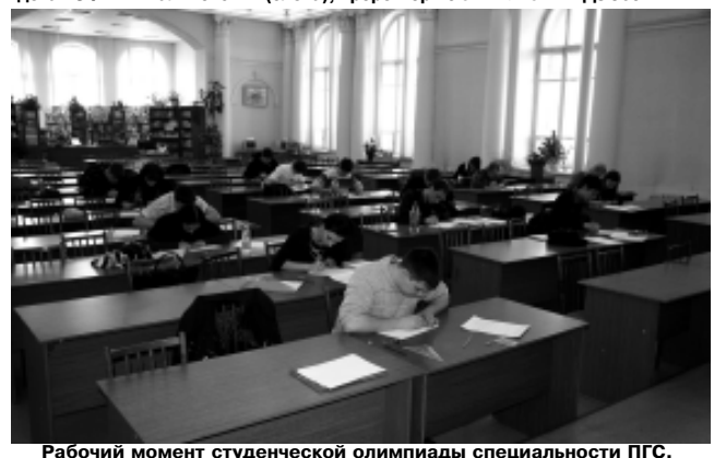
Рабочий момент студенческой олимпиады специальности ПГС.