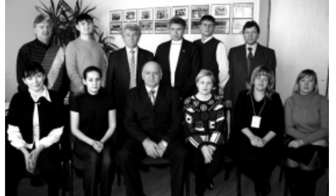
Представители вузов Сибирского региона - члены жюри конкурса (студенческой олимпиады) по направлению "Строительство".