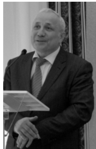
Ректор БрГУ С.В.Белокобыльский