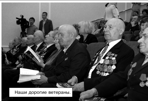
Наши дорогие ветераны.