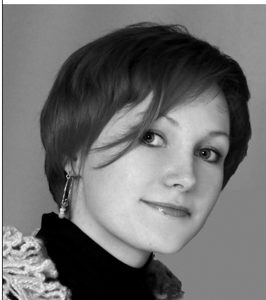
В апреле состоялся заключительный тур Всероссийского конкурса выпускных квалификационных работ по многим специальностям.

В Воронежском строительном университете такой конкурс состоялся по специальности «Производство строительных материалов изделий и конструкций».