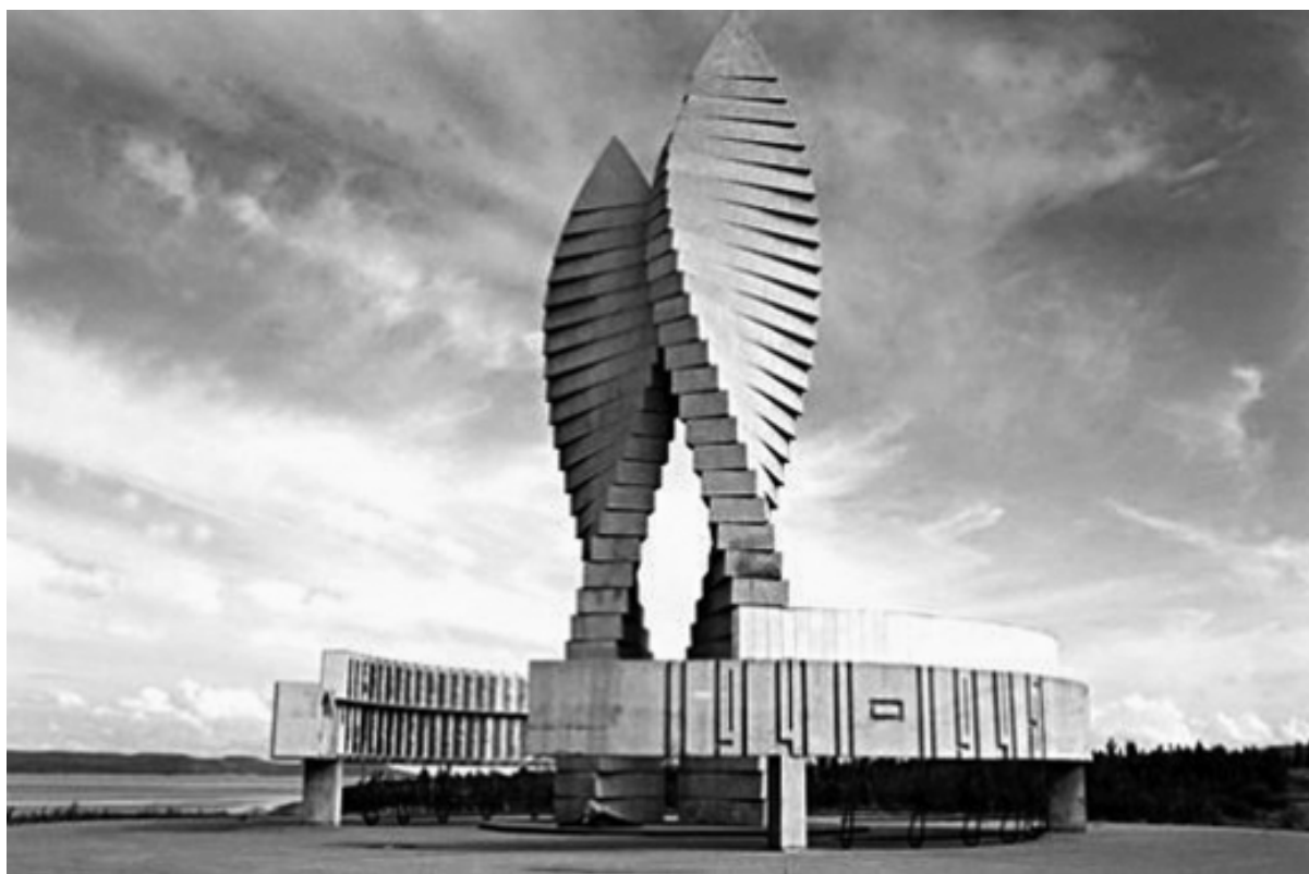
Мемориал Славы в г.Братске