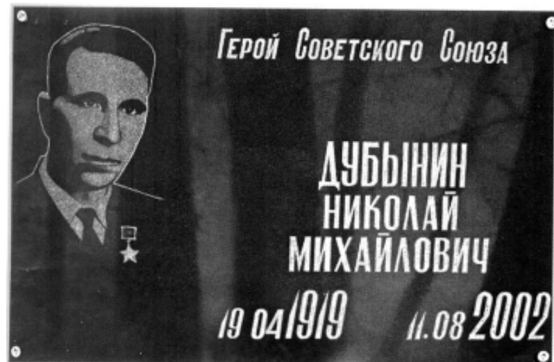
Мемориальная доска Герою Советского Союза Н.М.Дубынину