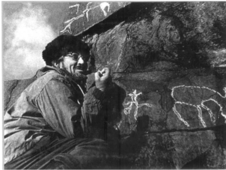
В 1975 году О.М. Леонов открыл Дубынинские писаницы

ложил енисейскому воеводе о завершении постройки Братского острожка в двух плесах у Брацкого порогу Падуна в Кондогоновых улусах на долднице ходу до