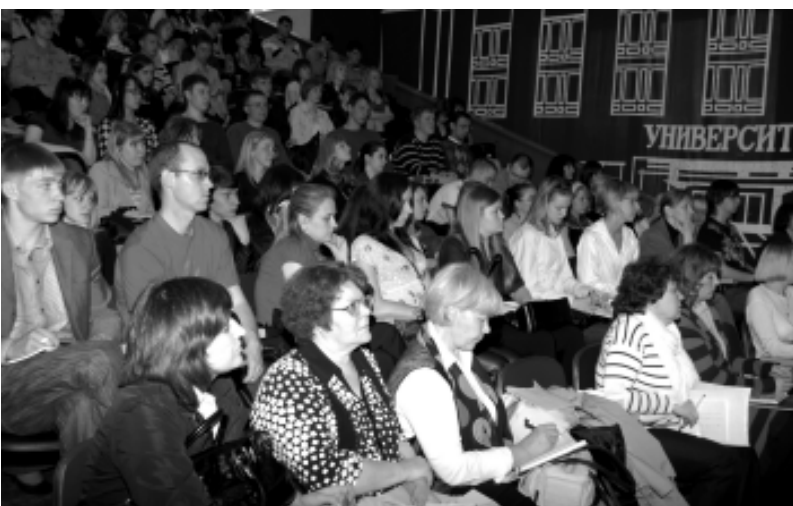
Ярмарка вакансий, состоявшаяся в БрГУ 26 мая с.г., на первом плане заинтересованные работодатели.

Эмма ЗАЧИНЯЕВА, наш собкор