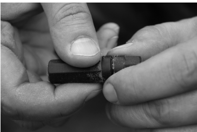
Момент вскрытия медальона бойца (оказался пустым).

20 апреля – особенная дата, можно сказать, время пик для поискового отряда «Братск». Вот уже третий год подряд отправляется в этот день экспедиция молодых братчан на новгородскую землю, где в 1941 году на подступах к Ленинграду шли ожесточеннейшие бои. Напомним: только по официальным данным здесь погубило более 800 тысяч советских солдат, а найдены и захоронены еще далеко не все. Весной и осенью туда собираются поисковики из многих городов России, чтобы найти и по возможности идентифицировать останки бойцов, погибших в боях за свое Отечество.