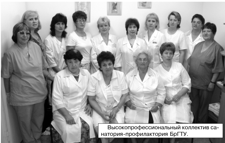
Высокопрофессиональный коллектив санатория-профилактория БрГУ.

Можно сказать, что в Братском госуниверситете уже существует основа для создания Центра здоровьесберегающих технологий и физической культуры со своей медико-экологической лабораторией. В рамках этого Центра будут объединены такие подразделения вуза, как кафедра физвоспитания, санаторий-профилакторий, внеучебный отдел, профкомы студентов и работников. Это даст возможность проводить научно-исследовательскую работу, мониторинг состояния здоровья студентов и сотрудников университета, а также оценивать влияние экологической обстановки на здоровье и