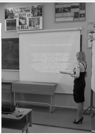
Фото отдела ТСО