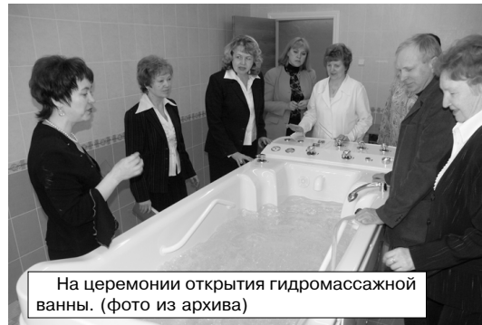
На церемонии открытия гидромассажной ванны.

22 июня с.г. механический факультет будет праздновать свой юбилей, к этому дню готовятся спецвыпуск газеты «Братский университет».