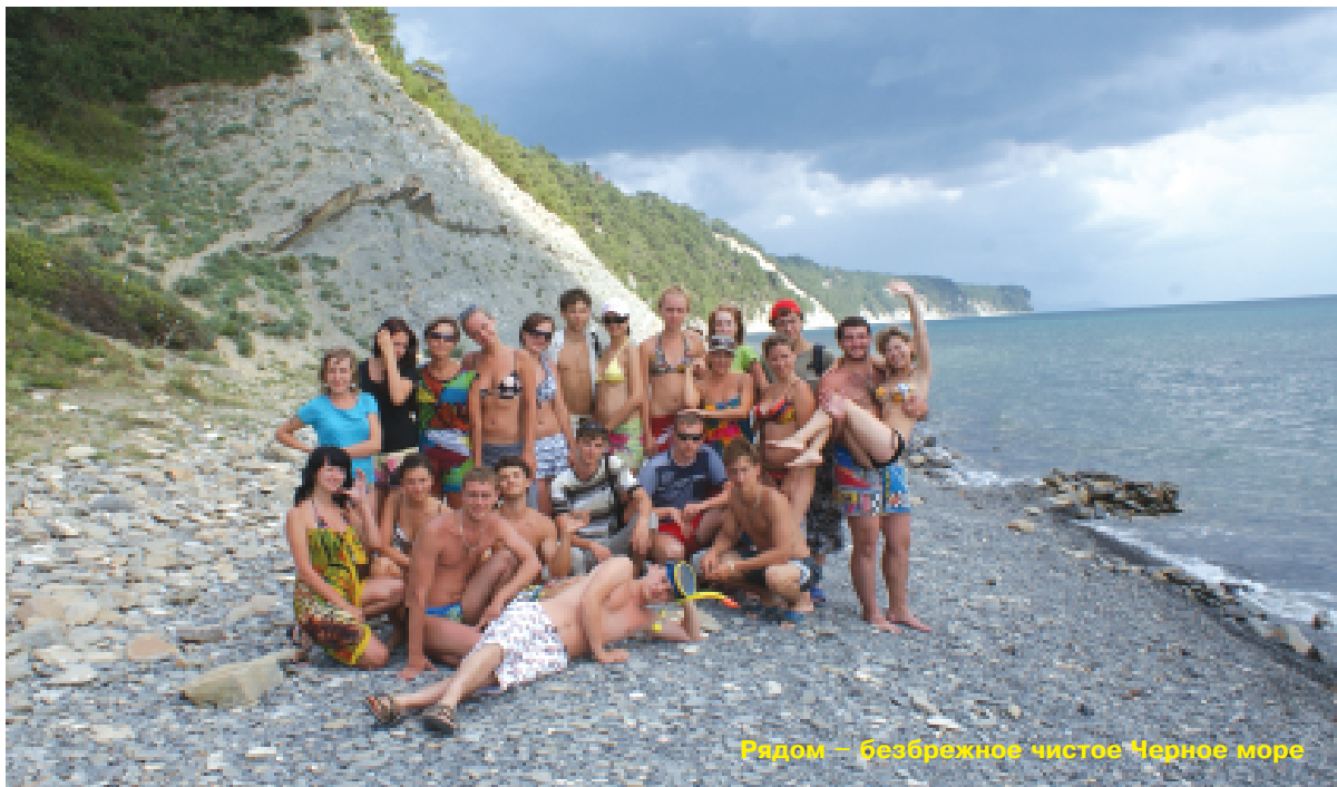
Рядом – безбрежное чистое Черное море

Но мы не могли долго сидеть на месте и в погоне за новыми эмоциями, посетили такие города Черноморского побережья, как Туапсе, Новороссийск, Анапа и Адлер. В го-