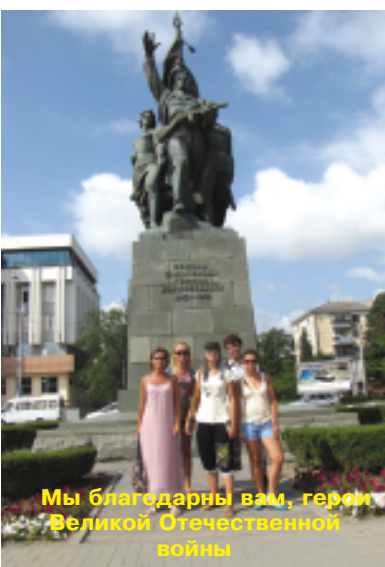
Мы благодарны вам, герои Великой Отечественной войны

роде-герое Новороссийске отправившись на экскурсию по легендарному крейсеру «Михаил Кутузов», который впечатлил своими внушительными размерами, величием и военной мощью. Новороссийск поразила нас своей чистотой, монументами и памятниками, установленными в честь героев Великой Отечественной войны. Мы помним о тех,