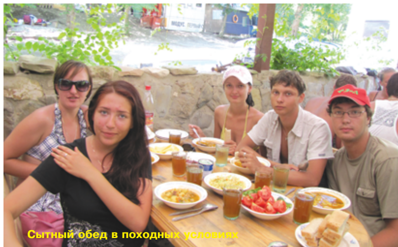
Сытный обед в походных условиях

Хорошие условия проживания, в столовой всегда вкусная и здоровая пища (с возможностью получить добавку!) – залог уникального отдыха.