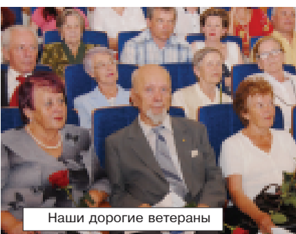
Наши дорогие ветераны

Механический факультет Братского государственного университета отметил свое 30-летие. К этой дате он подошел с отличными результатами. Сотни дипломов и медалей, десятки научных открытий, признание и уважение коллег в России и за рубежом, и что самое главное - тысячи благодарных выпускников, знания и опыт которых подтверждены десятилетиями успешной