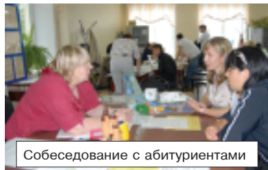
Собеседование с абитуриентами

На фоне ставшего уже привычным для страны сокращения бюджетных мест на специальности, не связанные с инженерно-техническим профилем,