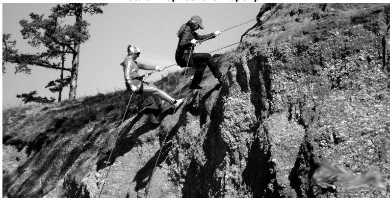
Ребята освоили навыки альпинизма.