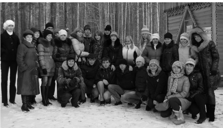
В начале экскурсионного пути.

Дружная, любознательная группа студентов лесопромышленного и гуманитарно-педагогического факультетов накануне 55-й годовщины родного города решили поближе познакомиться с историей малой Родины.