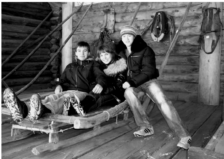
На подворье зажиточного сибирского крестьянина.

вотным. Если заблудишься в тайге, однако правильно истолкуешь специальные "знаки", то обязательно найдешь дорогу домой и голодным тоже не останешься! Студенты представляли себя то охотниками, то шаманами,