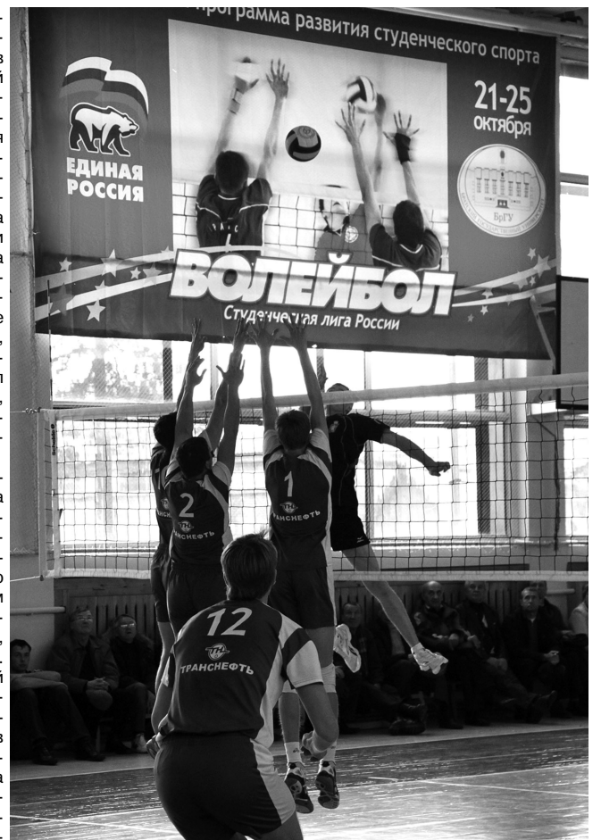
Поединок команд БрГУ и СибФУ

За отличную организацию игр и радужный прием спортсмены и болель-