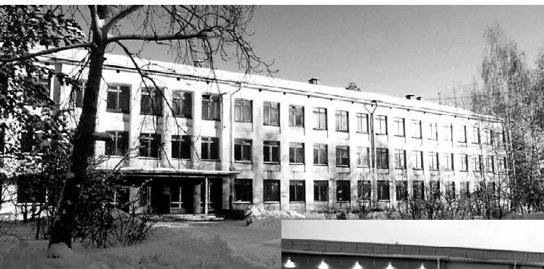
Первый корпус в 1964 году.