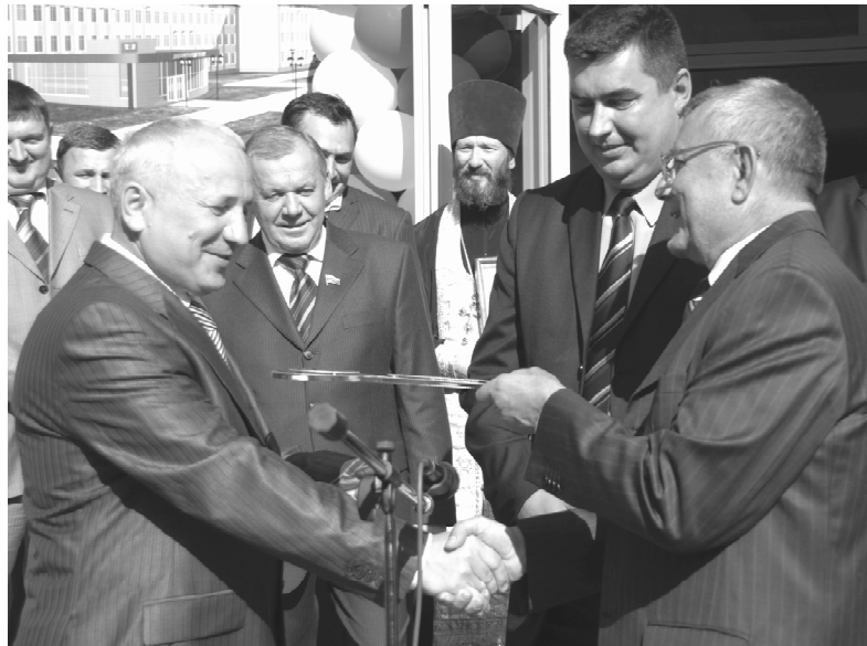
Открытие первого учебного корпуса после реконструкции, 1 сентября 2009 г.

Университет располагает всем необходимым не только для проведения учебных занятий на самом высоком уровне, но и для выполнения научных исследований, обеспечения комфортного быта и полезного досуга студентов. В их распоряжении 100 лабораторий, несколько лабораторных модулей для крупногаба-