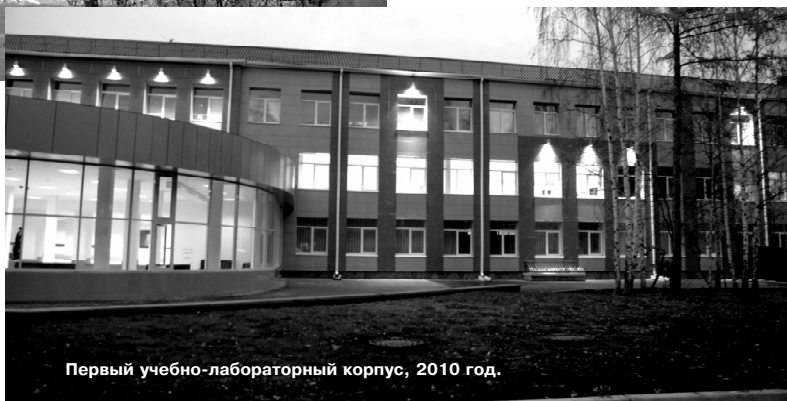
Первый учебно-лабораторный корпус, 2010 год.

Подготовка специалистов ведется по программам профессиональной подготовки рабочих, 19 программам среднего и 35 специальностям высшего профессионального образования, 8 направлениям бакалаврской подготовки и 8 направлениям магистерской подготовки. Профессорско-преподава-