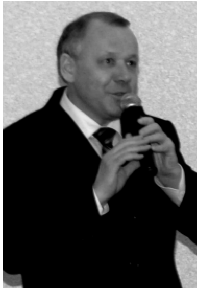
Депутат Госдумы РФ В.Б.Шуба.

Материалы, представленные на конференции, показали, что руководство и весь коллектив Братской ГЭС, а также ученые чутко держат руку на пульсе сложнейшего организма под названием "гидроэлектростанция", постоянно отслеживают не только ее состояние сегодня, но и заглядыва-