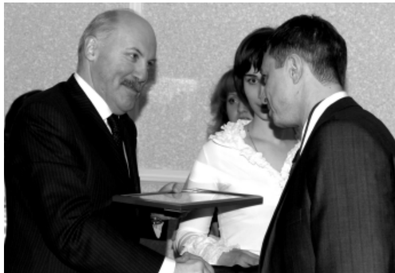
Почетные грамоты специалистам Братской ГЭС вручил губернатор Иркутской области Д.Ф.Мезенцев.

С кратким приветственным словом к участникам форума обратился ректор БрГУ С.В.Белокобыльский. Он особо подчеркнул тот факт, что вуз вот уже на протяжении более полувека готовит специалистов для такой важной отрасли народного хозяйства, как энергетика, в системе которой находится и Братская ГЭС. Университет поддержал праздник энергетиков вводом в учебный процесс после реконструкции первого учебно- лабора-