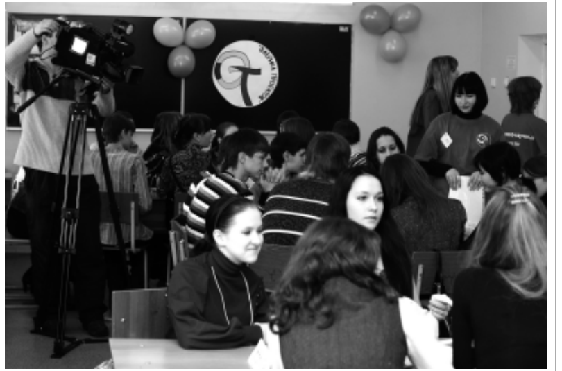
Выполнение конкурсных заданий.