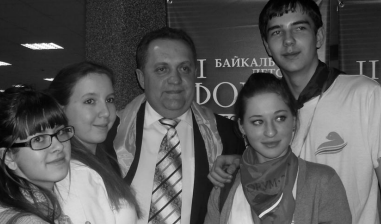
Участники форума с министром образования Иркутской области Виктором Басюком.

Уставшие после насыщенного событиями и встречами дня мы вернулись в "Галактику". Думали, отдохнем. Но не тут-то было! В 20.30 мы только поужинали. Затем разошлись по редакциям. Поработали чу-