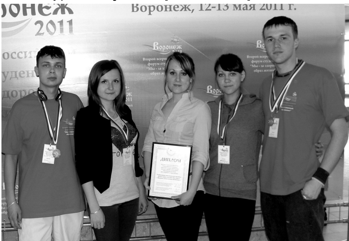
Команда братчан не подвела

Помимо запланированных "круглых столов" и конференций, программа Форума была насыщена яркими мероприятиями для студентов. Утреннюю зарядку для них провел олимпийский чемпион по прыжкам в воду Дмитрий Саутин. Заряд бодрости и отличного настроения продлил моло-