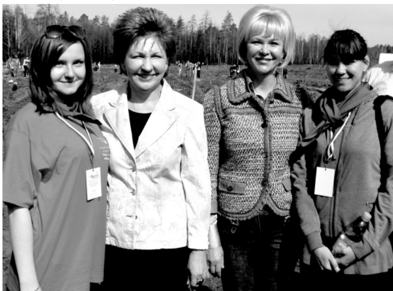
С депутатами Госдумы РФ Г. Кареловой и Т. Яковлевой