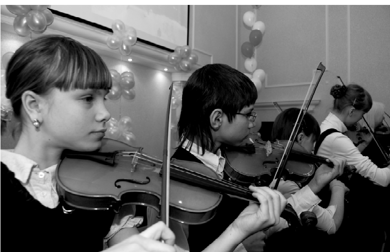
Ансамбль скрипачей из Вихоревки принимали на ура.