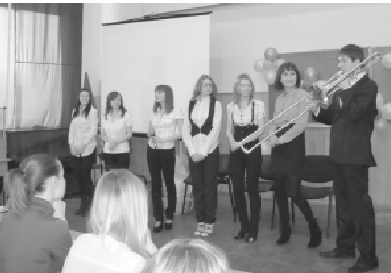
Приветствие кафедры ЭиТБ.

Благодарим деканат факультета экономики и управления и отдел ТСО за оказанную помощь в проведении мероприятия. А ребятам - новых творческих побед!