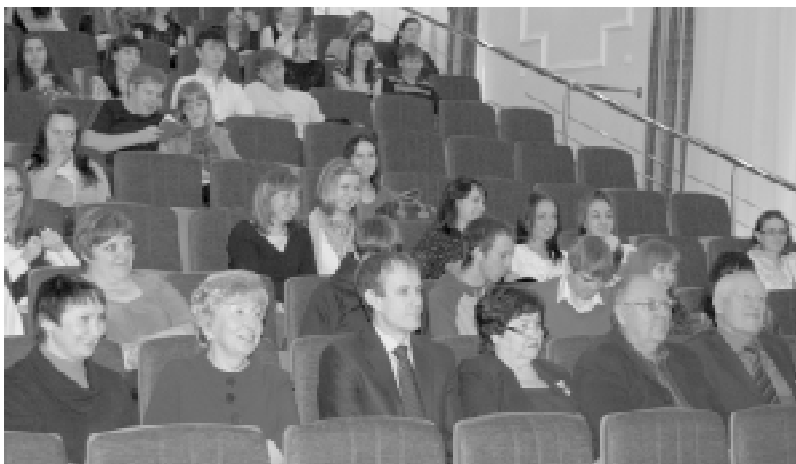
Педагоги факультета экономики и управления рады встрече с будущими абитуриентами.

На носу выпускные экзамены в школе. И перед будущими абитуриентами стоит важный вопрос - куда пойти учиться? Предстоит сделать выбор, от которого будет зависеть вся дальнейшая жизнь. Поэтому нужно взвесить все за и против. Окончательное решение принять довольно сложно. В прошедшую субботу наш вуз помог будущим абитуриентам Братска и их родителям выбрать верный путь. Напомним, что с начала учебного года профориентационные команды БрГУ побывали в десятках городов, поселков и населенных пунктов региона (см. фото), где всесторонне, с показом фильмов, подготовленных медиалабораторией, знакомили учащихся 11-х классов, учителей, родителей, представителей администраций муниципальных образований с достойно зарекомендовавшим себя высшим учебным заведением - Братским государственным университетом.