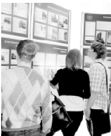
Возле стендов вуза.