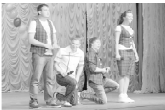
Команда КВН "Три целых, она - четвертая".

вал присутствующих песней, на этот раз французской балладой о любви "Si mes larmes".