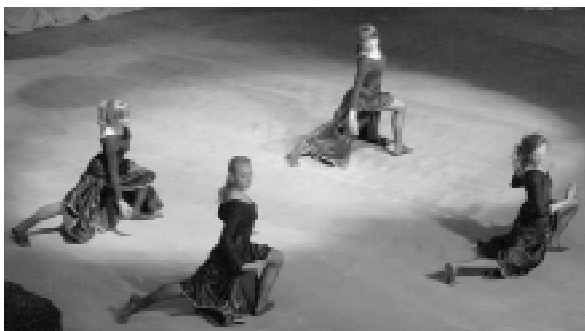
Танцевальный коллектив "Грация".

Атмосферу торжественности празднику привнесло выступление народной студенческой академической хоровой капеллы "Гаудеамус", при звуках гимна сту-