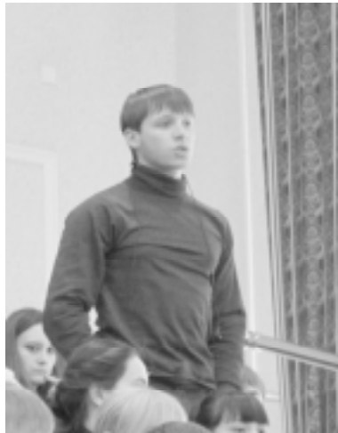
Студенты интересовались летним оздоровлением.

учебно-методического управления Г.П.Нежевец. Успешное прохождение этого испытания означает получение в очередной раз