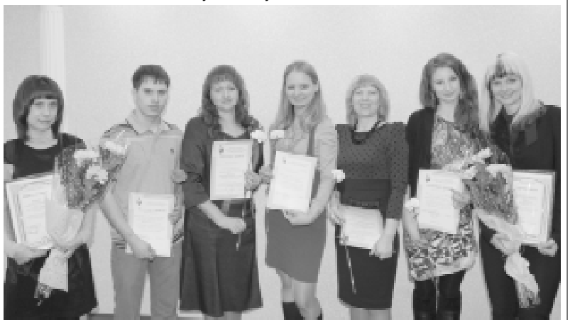
Активисты студенческого профкома отмечены достойными наградами.

Эмма ЗАЧИНЯЕВА, наш собкор