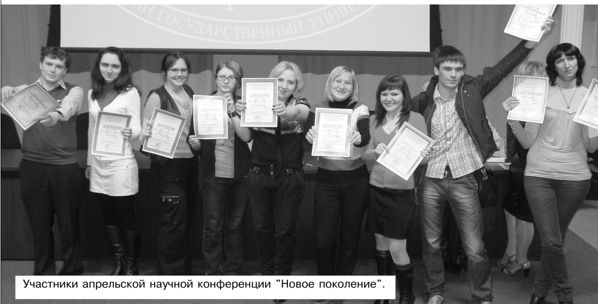
Участники апрельской научной конференции "Новое поколение".

От редакции: отчет о работе РЦСТ заслушан и утвержден на очередном заседании ученого совета БрГУ; здесь публикуется в сокращении.