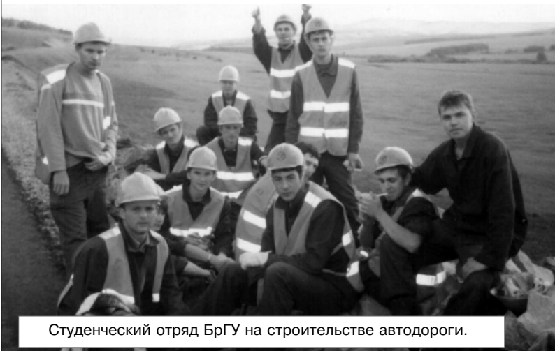
Студенческий отряд БрГУ на строительстве автодороги.

По результатам каждой "Ярмарки вакансий" более 100 выпускников получают предложения от работодателей на трудоустройство. Кроме того, выпускники оставляют о себе информацию в базе данных ЦЗН г.Братска, которой активно интересуются все работодатели.