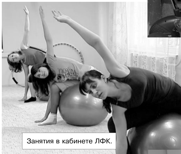
Занятия в кабинете ЛФК.

Основным направлением здоровьесберегающей деятельности санатория-профилактория являются внедрение современных медицинских технологий и, в связи с этим, снижение заболеваемости.