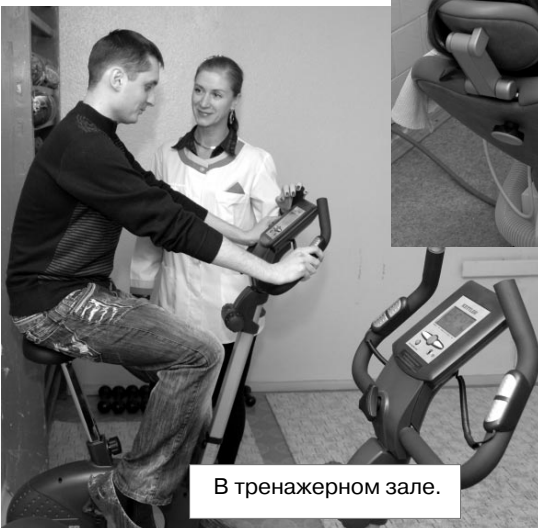
В тренажерном зале.

Правительством Российской Федерации определена стратегия модернизации демографической политики государства. В основе - сохранение и приумножение здоровья нации, и в первую очередь подрастающего поколения.