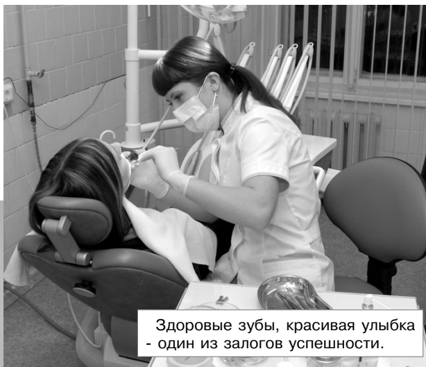
Здоровые зубы, красивая улыбка - один из залогов успешности.

Все это позволяет повысить физическую и умственную работоспособность студентов, улучшает