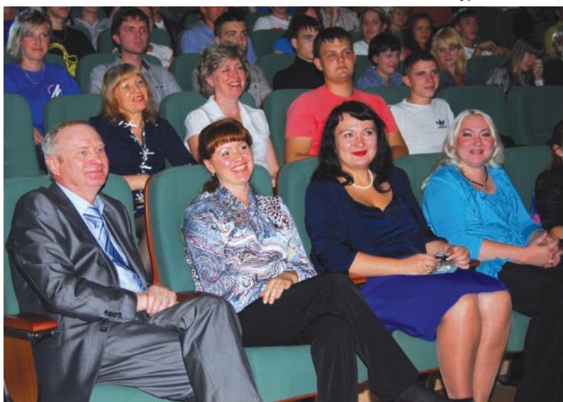
Живые эмоции зала.

мым в свою копилку опыт, а нашему городу - ярких красок. Городской конкурс "Солнечное настроение", конкурс 3D рисунков,