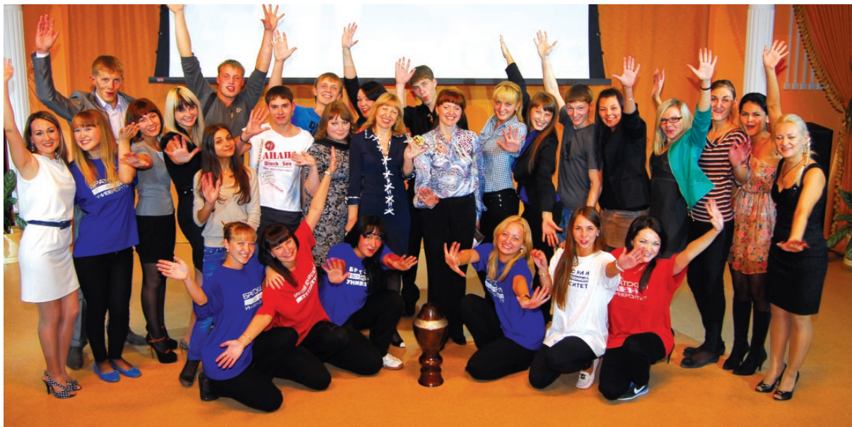
Привет от отдыхающих в Анапе.