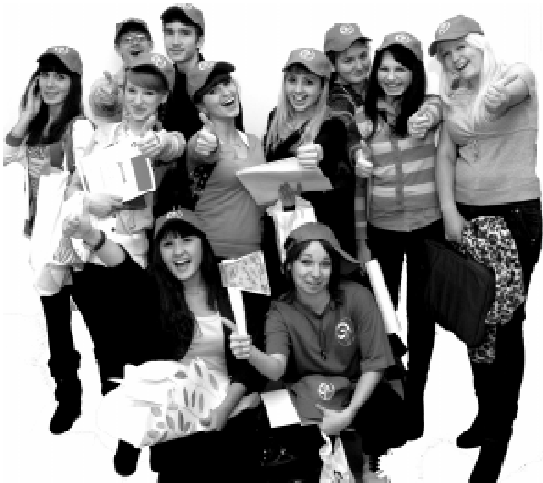
Победитель олимпиады - агентство "Биогеоценоз".

В течение двух дней юные экологи выполняли разнообразные конкурсные задания, выявляющие их знания и творческий потенциал. Старшеклассники и учащиеся средних специальных учебных заведений из Братска, Тулуна, Нижнеудинска и других городов региона могли показать свои знания в областях экологии и биологии в "Брейн-ринге" и через заполнение "ЭКОкроссворда". Все это проходило под руководством кураторов и дежурных кураторов из числа студентов естественнонаучного факультета. Также участники посостязались на личном первенстве и в конкурсе "Соперники". "Креативная мозаика" прошла в формате презентации экоагентств, на которые заранее по традиции были разделены участники олимпиады.