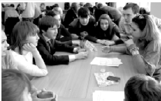
Агентство "Колония одноклеточных".

два дня показали высокий уровень подготовки, многие участники уже не первый год приезжают на олимпиаду, что говорит о значимости данного мероприятия.