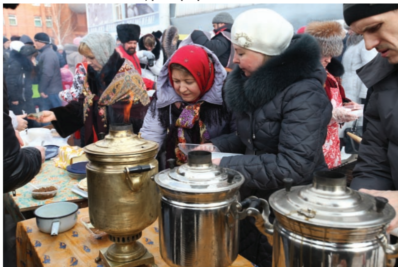
Угощение на любой вкус.