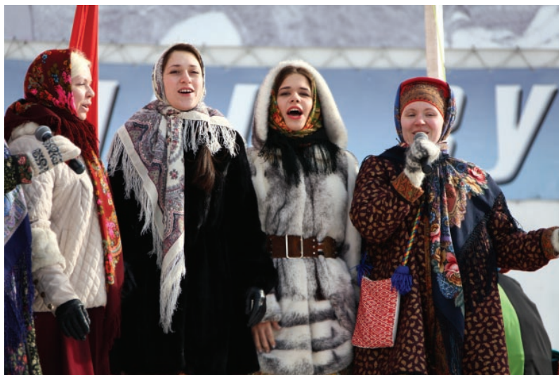
Радуйся, народ, на дворе Масленица!

Анастасия ШИХАЛЕВА, наш собкор