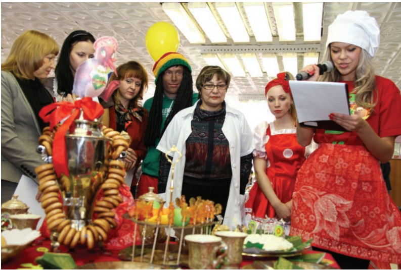
Презентация команды ФЭИА

"Масленица идет, блин да мед несет!" - говорят в народе. Поэтому не испечь на Масленицу блинов, то же, что встретить Новый год без елки! В связи с этим традиционный конкурс "Студенческая кухня" носил прикладной характер.