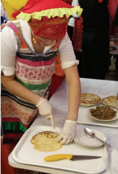
Старательные хозяйки ЕНФ

После небольшой музыкальной паузы стартовал второй этап конкурса: оформление и презентация фруктового ассорти. Всем командам был выдан заранее заготовленный набор фруктов, дальнейшее - на усмотрение конкурсантов. Получившиеся в прямом смысле шедевры были представлены на суд жюри: фруктовая карта соковриш, яркий и необыкновенный пингвин и павлин, изящный лебедь и многое другое. Сделать выбор в пользу кого-то одного было очень сложно! В этом этапе пальма первенства с большим перевесом досталась факультету энергетике и автоматике - команде "Киви".