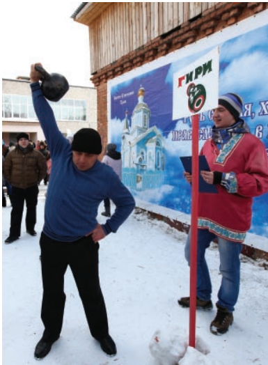
Посмотрим, кто сильнее...