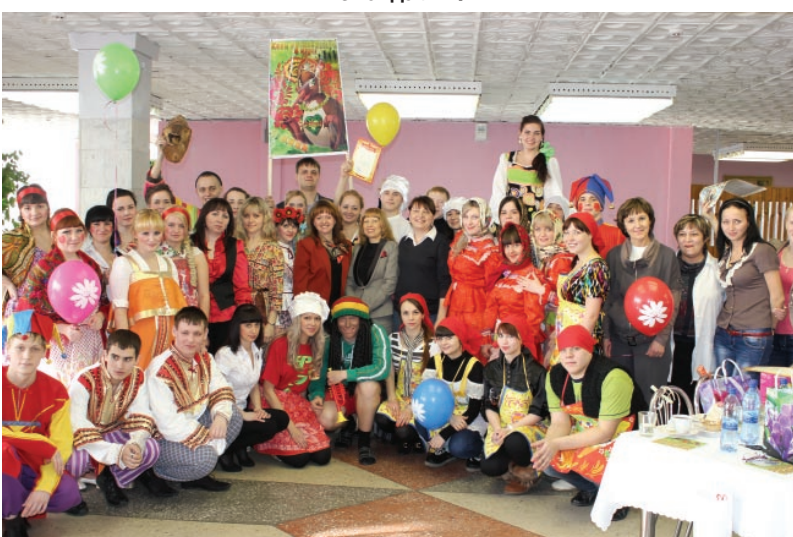
Как здорово, что все мы здесь сегодня собрались!