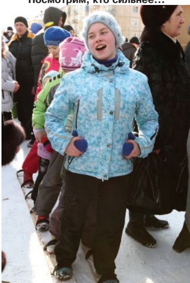
Забав на Масленице не честь