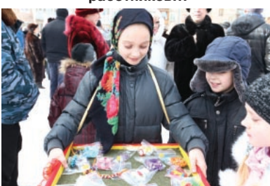
Подходите, люди добрые!