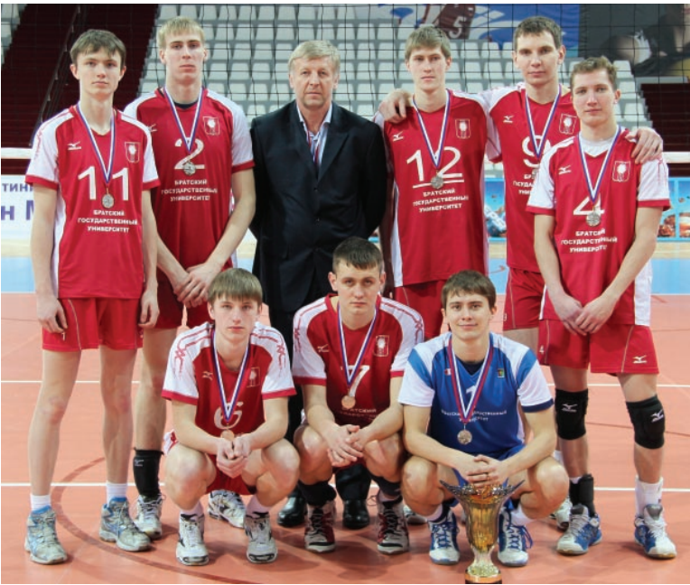
Волейбольная команда БрГУ

С 27 февраля по 2 марта в г. Улан-Удэ проходил Чемпионат студенческой волейбольной лиги России среди мужских команд вузов Сибири и Дальнего Востока.