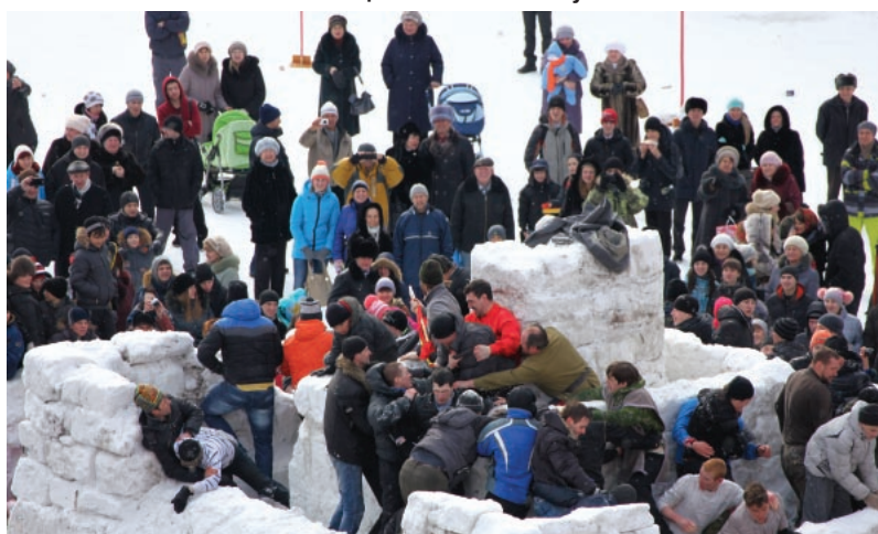
Взятие снежной крепости