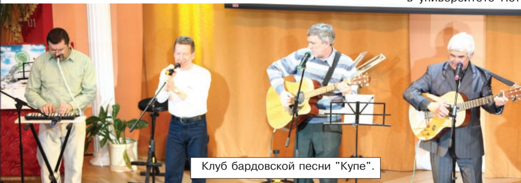
Клуб бардовской песни "Купе".