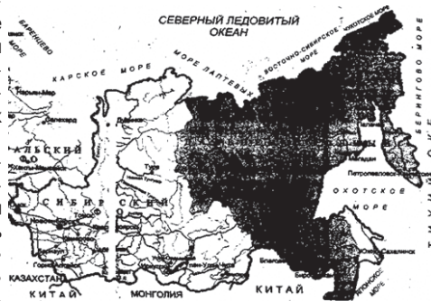
Как же обширны необжитые пока территории России...

- По направлению "Отечественная история" защищено 4 кандидатских диссертации, подготовлено 5 аспирантов и один соискатель. В рамках еще одного направления - "Международная деятельность" - ученые-историки БрГУ выступают на международных конференциях, посвященных актуальным проблемам цивилизационного процесса, публикуются в печати. В частности, в одном из немецких научных изданий опубликована моя монография "Формирование транспортных коммуникаций Российской Сибири". Она распространяется по всему миру, несколько экземпляров заказаны библиотекой Конгресса США, университетами мира. Готовится к изданию монография "Схватка за Северо-Евразию". Третье направ-