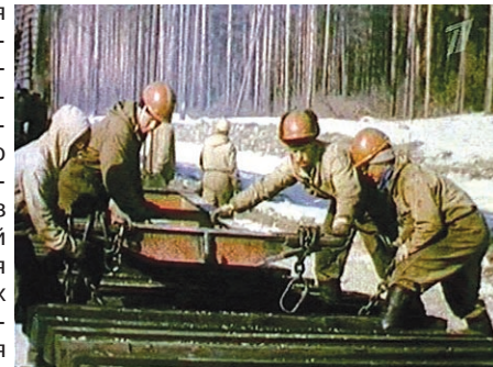
Байкало-Амурская магистраль - вежа в освоении Сибири и Дальнего Востока.

политикой, включив все республики Средней Азии (Туркмению, Казахстан, Таджикистан, Киргизию) в состав СССР. Сегодня эти территории могут быть потеряны, если не осуществить евроазиатский проект. Именно поэтому мы просто обязаны сосредоточить научные усилия по исследованию проблем хозяйственного укрепле-