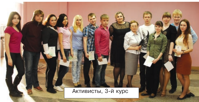
Активисты, 3-й курс

Но все же какой конкурс без победителя? 1-ое место завоевала самая активная, веселая и дружная группа - ИСиТ-12, второе досталось девчатам из группы ЭКО-09, третьими стали программисты из группы ПМИИ-10. Молодцы! Ребята получили грамоты, вкусные торты, а также ручки с логотипом группы для каждого студента. Но это еще не все! Группа ИСиТ-12 получила сертификаты от профкома студентов, а также от деканата ЕНФ на 2500