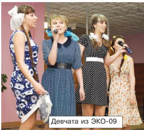
Девчата из ЭКО-09

отделу ТСО, медиалаборатории и столовой БрГУ - за многолетнее сотрудничество и помощь в организации традиционных мероприятий для студентов ЕНФ.