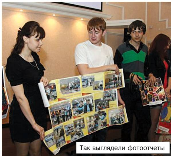
Так выглядели фотоотчеты

Восьмым этапом стал контроль по отсутствию задолженности по профсоюзным членским взносам, которые проходили в январе и мае. Отрадно, что основная часть