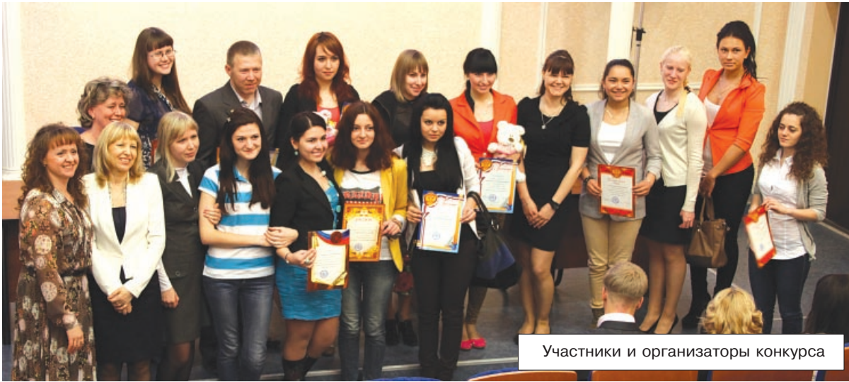
Участники и организаторы конкурса

дартам дресс-кода, а у других - "кричащим" и креативным, протестующим против введения стандартов.