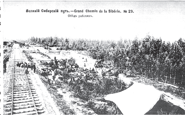
Великий Сибирский путь. — Grand Chemin de la Sibirie. № 29. Область рабочих.

века, так как было очевидно: управлять богатейшими районами империи без надежных путей сообщения невозможно. Эта идея имела и своих противников, которые пугали энтузиастов гнилыми болотами, дремучей тайгой, зимними холодами и невозможностью развивать в этих краях сельское хозяйство. Однако экономическая целесообразность склоняла чашу весов в пользу строительства магистрали. Возведение железной дороги по праву считалось событием мирового значения. Если бы не был построен Транссиб, то Россия наверняка утратила бы большинство северных территорий.