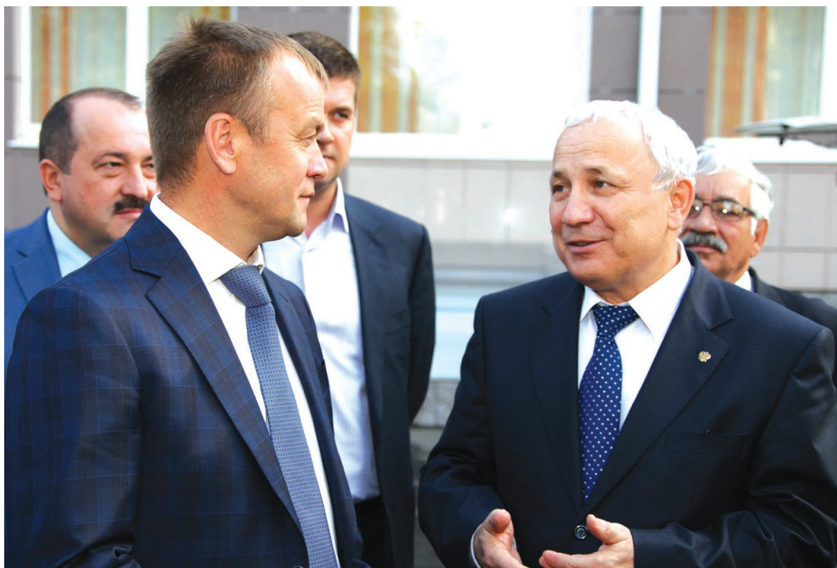
Начало диалога на территории альма-матер