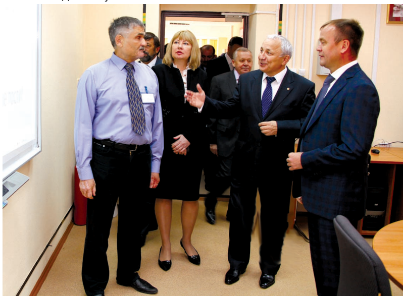
В корпоративном учебно-исследовательском центре "Иркутскэнерго-БрГУ"