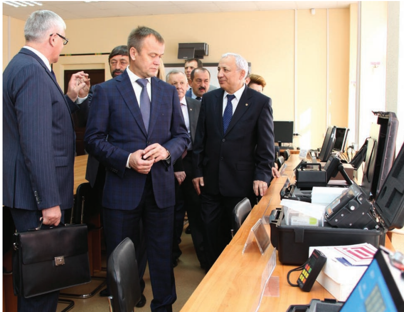
В центре коллективного пользования

Анастасия ШИХАЛЕВА, наш собкор