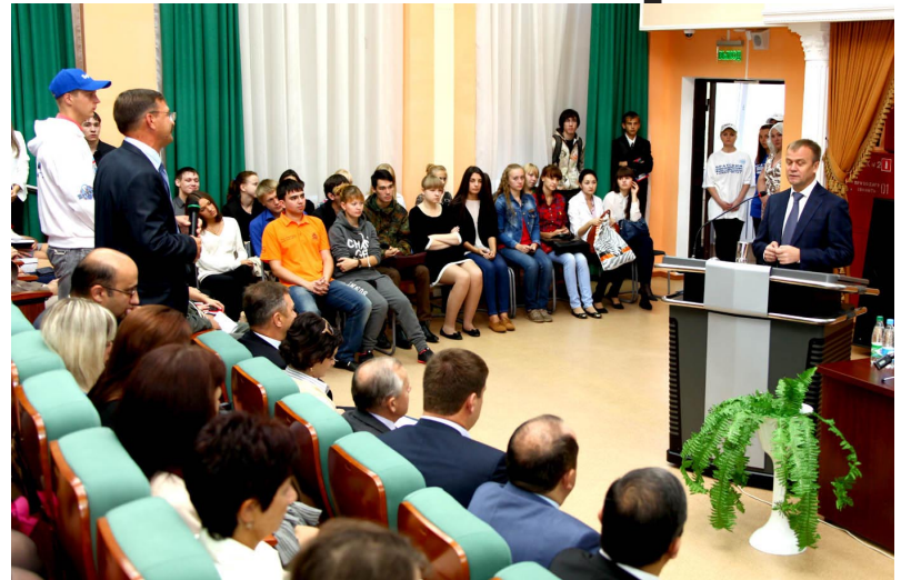
Непринужденное общение с коллективом университета