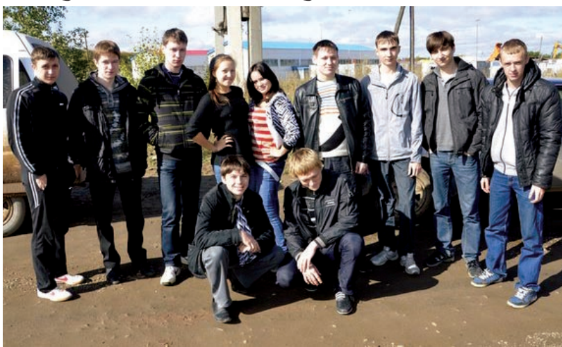
На снимках: наша жизнерадостная группа

Финал конкурса был совмещен с празднованием традиционного мероприятия "Капустник на ЕНФ", который состоялся 17 мая этого года. Каждая группа, дошедшая до финала, должна была себя презентовать, с чем ребята прекрасно справились. В финале вечера были объявлены результаты: победу одержали первокурсники