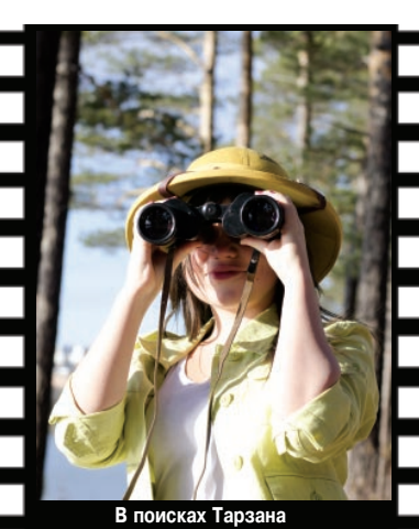
В поисках Тарзана

Первая съемочная площадка оказалась на горе, где часто