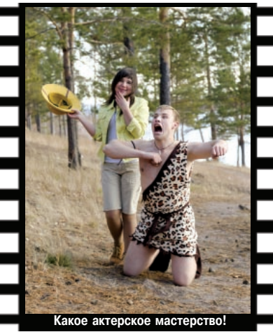
Какое актерское мастерство!

Время пребывания на Тенге составило шесть часов. Замерзшие, но довольные результатом своей работы, все отправились домой. Это лишь