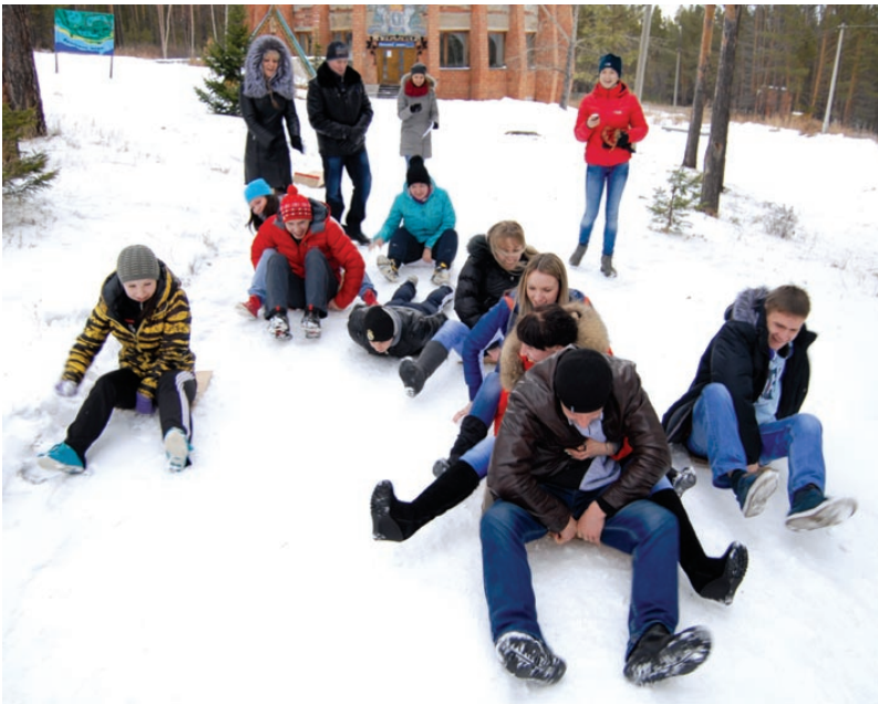
Эх, прокатимся с ветерком!

В преддверии Дня здоровья для студентов, проживающих в общежитиях, был организован традиционный выезд в санаторий "Братское взморье". 70 иногородних студентов-активистов весело и с пользой провели субботний день, который, мы надеемся, останется в их памяти надолго.