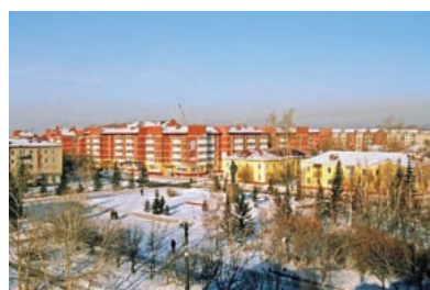
Есть рядом с Иркутском город Шелехов, названный в честь купца и путешественника, патриота России Григория Шелехова

И вот недавно порадовалась, прочитав в иркутской газете "День Сибири" статью о выставке, посвященной 200-летию русского поселения Форта Росс на американском континенте. Организовывал форт российский купец Григорий Шелехов. Русскую территорию продала США Екатерина II. Ныне там находится национальный исторический парк США. На выставке экспонаты краеведческого музея, предметы быта коренных народов Аляски, а также книги Григория Шелехова. Он привез в Иркутск с Аляски четыре семьи краснокожих жителей. Позднее они смешались с сибиряками, говорят, их потомки живут и в Братске.