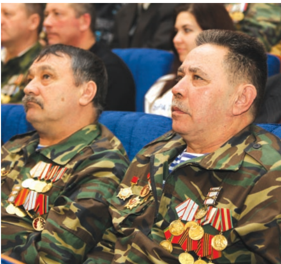
Ветераны афганской войны