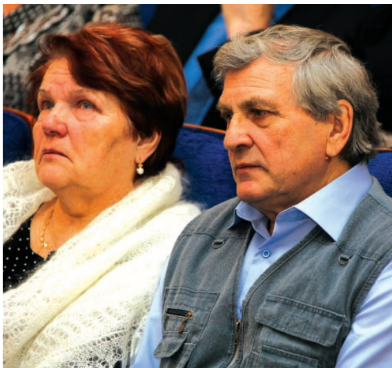
Их сыновья не вернулись домой...

Эмма ЗАЧИНЯЕВА, наш собкор