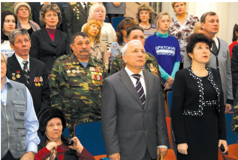
Звучит гимн России

Начало торжественного мероприятия, запланированного на 15 февраля в Братском государственном университете, несколько затягивалось. Первые 10 рядов актового зала, отведенных для гостей, пустовали. Причина отсутствия была уважительной: перед встречей в вузе делегация, куда входили бывшие воины-афганцы, члены их семей, представители городской администрации и обществу, побывала в 7-м микрорайоне у мемориального знака, установленного в честь воинов-интернационалистов, не вернувшихся в родной город с полей сражений.