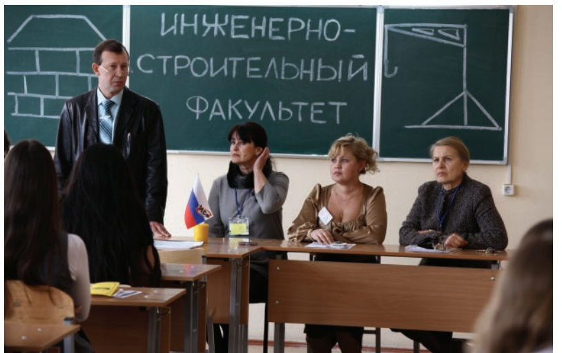
Встречи на факультетах.

кой презентации вуза, а также помня рекомендации знакомых, родных, их теплые отзывы, многие уже сейчас точно решили, что прочно свяжут свое будущее