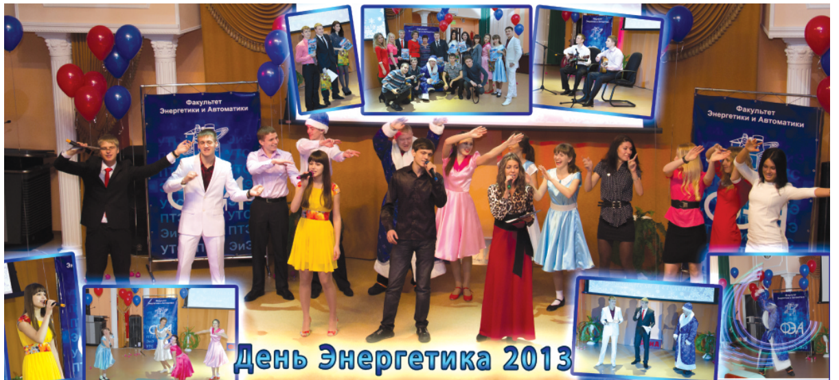
День Энергетика 2013

День энергетика - не только замечательный праздник, но и повод подвести итоги за год работы. В этот день отличившиеся ребята-энергетики были награждены грамотами, благодарственными письмами и сладкими подарками. Отмечены и наши