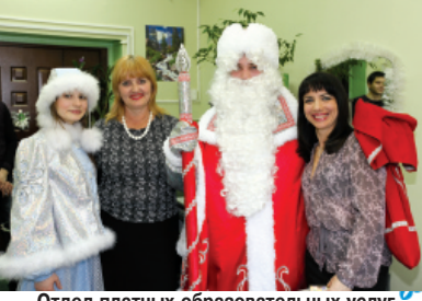
Отдел платных образовательных услуг рад новым гостям, но особенно рад, когда студенты договорной основы вовремя оплачивают свое обучение в БрГУ