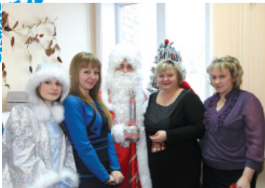
В приемной проректоров по экономике и развитию вуза и инновационной деятельности