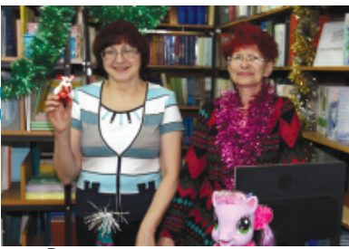
В читальном зале второго корпуса - третье место в новогоднем оформительском конкурсе