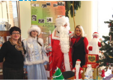
Любимый музей истории университета приготовил очередной подарок - выставку старых новогодних игрушек