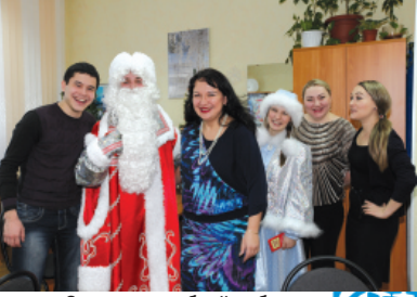
Отдел внеучебной работы, он же студенческий клуб, всегда в тонусе!