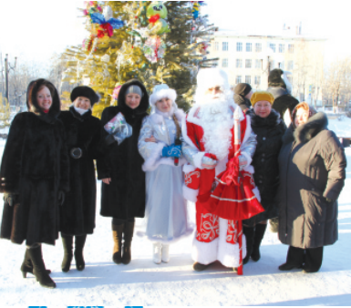
На открытии Елки