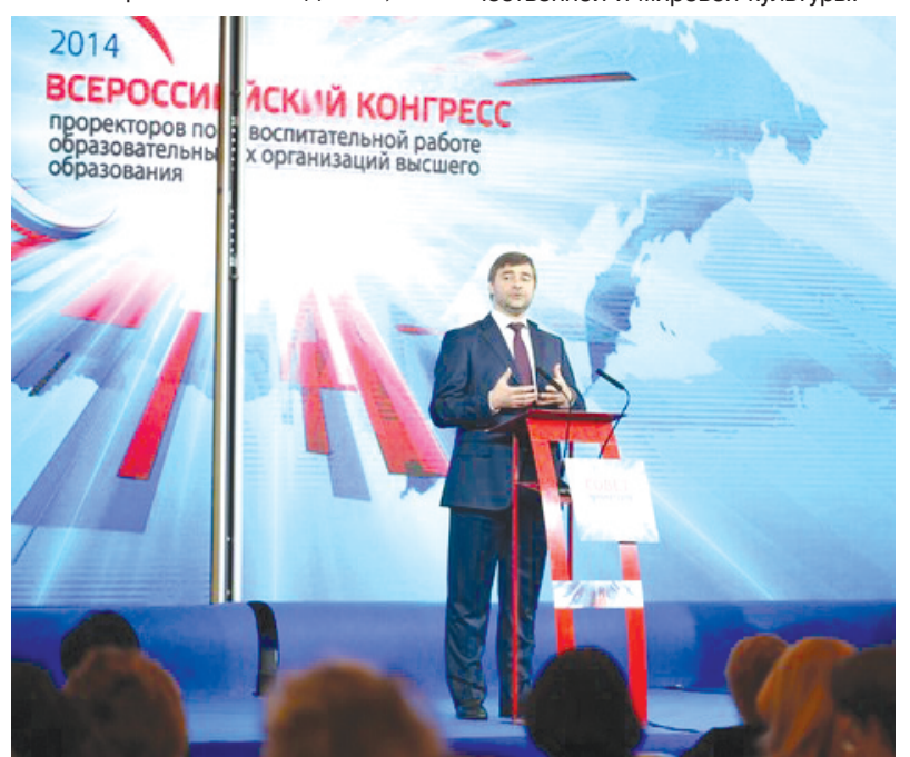
Выступает заместитель председателя Госдумы РФ С.В. Железняк

- добровольческой деятельности; - укреплять престиж активного и здорового образа жизни; - добиваться, чтобы студенческое самоуправление становилось школой студенческого актива, наделаясь действительно значимыми полномочиями и ответственностью за результаты деятельности; - используя дополнительные возможности 2014 года как Года культуры, расширить связи и контакты с учреждениями и деятелями культуры, способствовать приобщению студентов к сокровищам отечественной и мировой культуры.