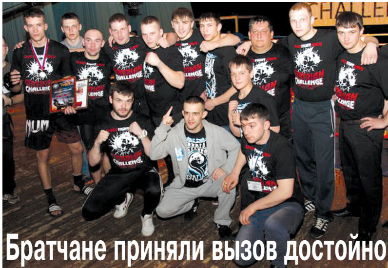
Братчане приняли вызов достойно

Участниками турнира стали спортсмены из Красноярска, Хабаровска, Железногорска-Илимского, Иркутска, Усть-Илимска, Москвы, Ульяновска, Боснии и Герцеговины (Сараево), Финляндии (Хельсинки), Сербии (Белград) и, конечно же, братчане - студенты нашего университета.