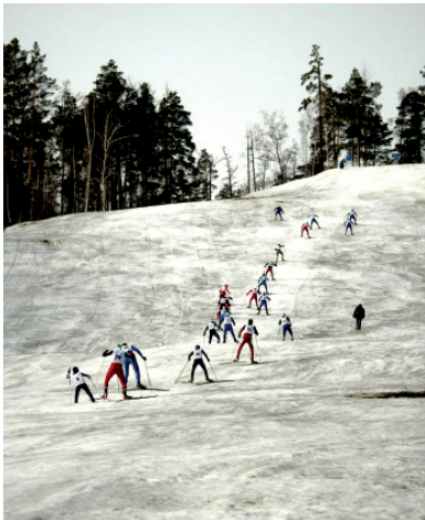
Слабых гора не принимала

Опуская подробности героического подъема, а его длина составила 1100 метров, перепад высот 260 метров, назовем победителей.