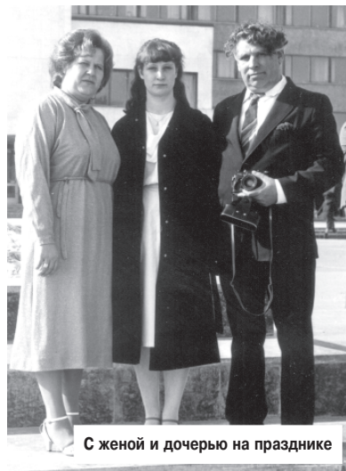
С женой и дочерью на празднике

В 1994 году дедушка попал с инфарктом в больницу, лечился там два месяца, ушел на инвалидность. Так прекратились его любимые занятия - охота и ры-