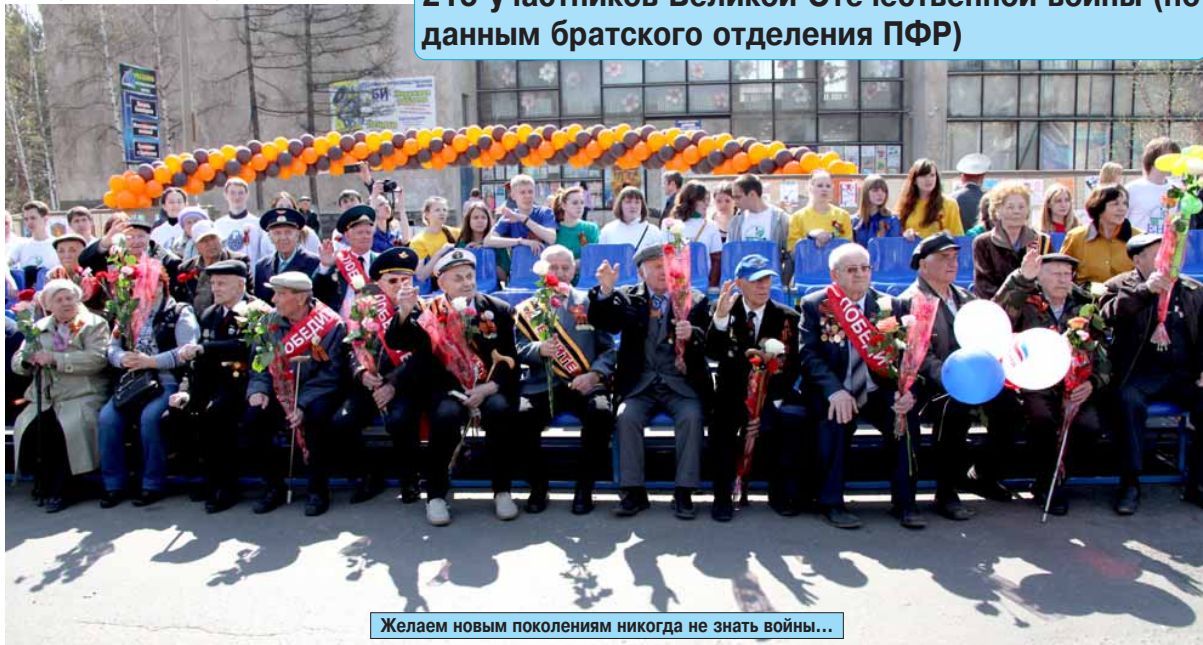
Желаем новым поколениям никогда не знать войны...

В Братске и Братском районе проживают сегодня 215 участников Великой Отечественной войны (по данным братского отделения ПФР)