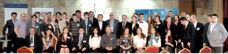
Участники форума в Подмоскovie

Студенты кафедры МИИТ приняли участие в российско-белорусском форуме инновационных социальных проектов "Россия и Беларусь - видение общего будущего".