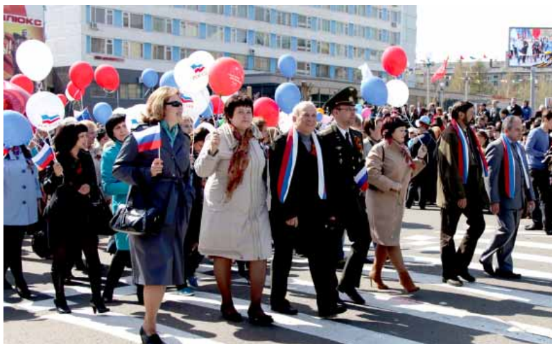
Впереди колонны БрГУ ректорат, председатель профкома работников

во время прохождения мощной университетской колонны особенно приятно было слышать из репродуктора информацию о том, как наш вуз помогает ветеранам, ведет большую работу по формированию у студенческой молодежи гражданско-патриоти-