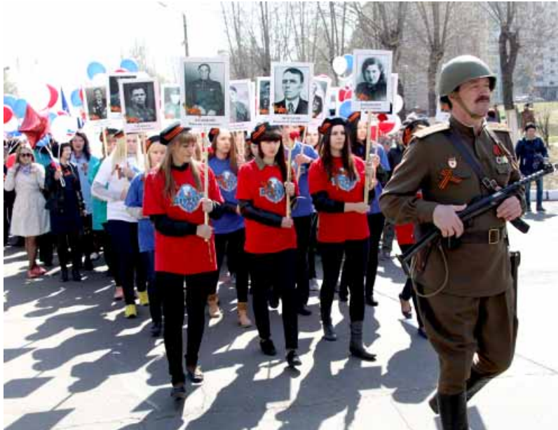
"Бессмертный полк": фотографии ветеранов (родственников работников вуза) несут студенты - волонтеры

9 Мая и накануне великого праздника в Братске прошла серия праздничных мероприятий, о которых можно коротко прочесть на страницах этого номера.