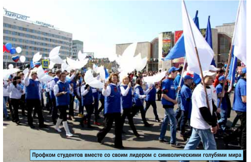
Профком студентов вместе со своим лидером с символическими голубями мира

В 2013 году БрГУ вновь не остался в стороне от празднования Дня победы, подготовив новое,