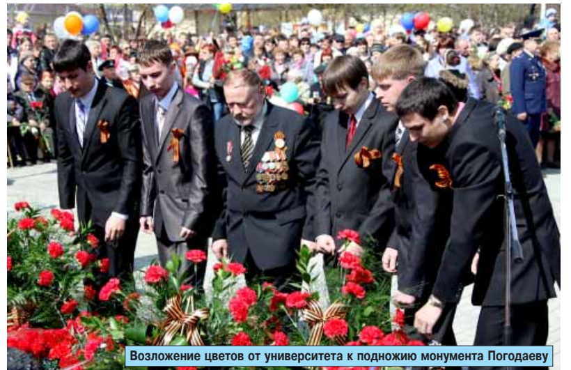
Возложение цветов от университета к подножию монумента Погодаеву

30 апреля прошлого года в университете состоялся "круглый стол" по актуальнейшей теме "Ценностные ориентиры молодой России". По итогам встречи, вызвавшей живой отклик в молодежных и ветеранских кругах города, было принято обращение к общественности Братска с просьбой усилить патриотическое воспитание подрастающего поколения, акцентировав