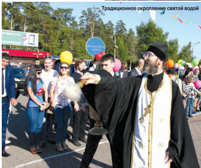
Традиционное окропление святой водой

Конечно, не обошлось без традиционной клятвы первокурсника. Клянемся! Быть верными единому духу студенческого братства; с достоинством нести звание студентов альма-матер, не жалея