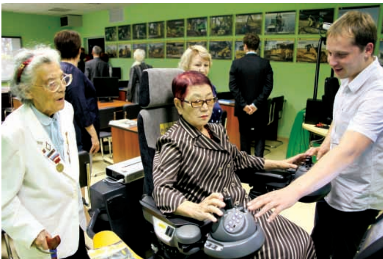
Ветераны в аудиториях лесопромышленного факультета