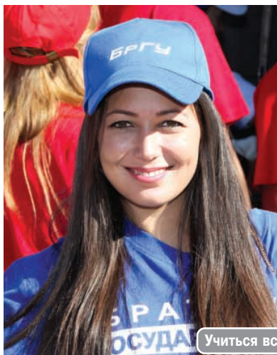
Учиться всегда готовы!

Опытный руководитель вуза, общественный деятель и ветеран высшей школы обращается к гостям праздника, преподавателям, студентам и сотрудникам университета: "Сегодня первый день сентября, первый день нового учебного года! Мы всегда волнуемся, когда готовимся отмечать эту дату. И всегда гордимся достижениями наших многочисленных выпускников. Мы верим в успехи наших студентов, для которых университет стал родным домом. И мы смотрим