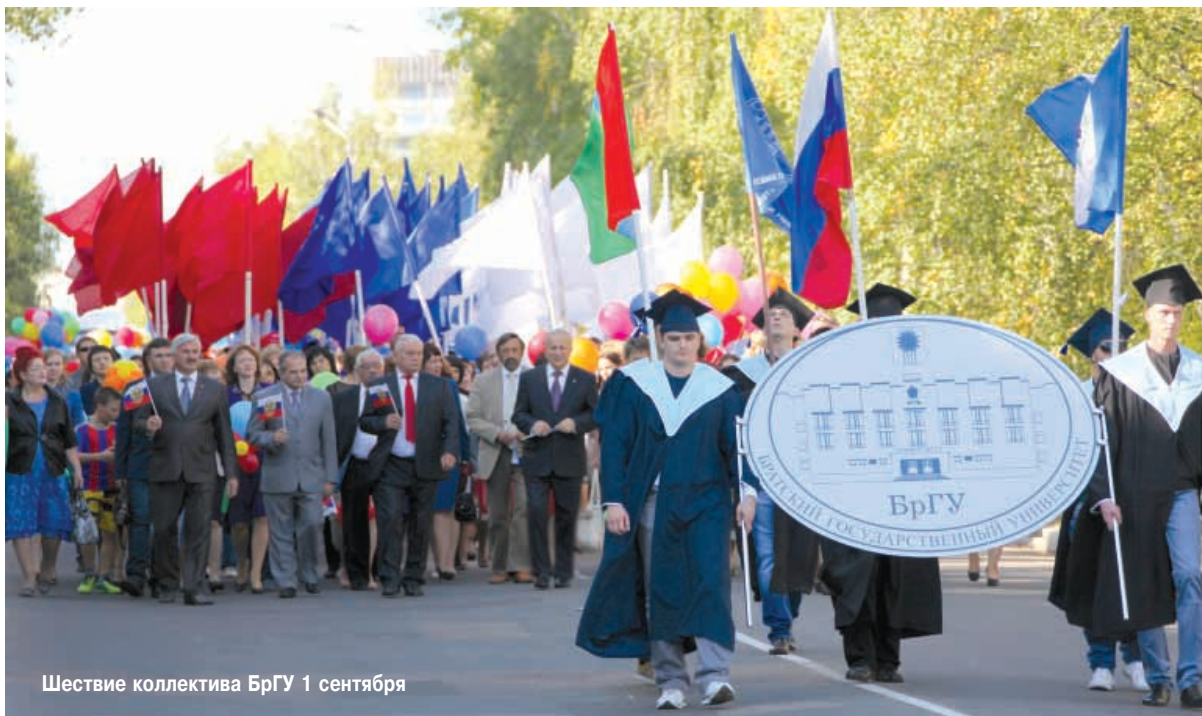
Шествие коллектива БрГУ 1 сентября

На площади факультетские студенческо-преподавательские