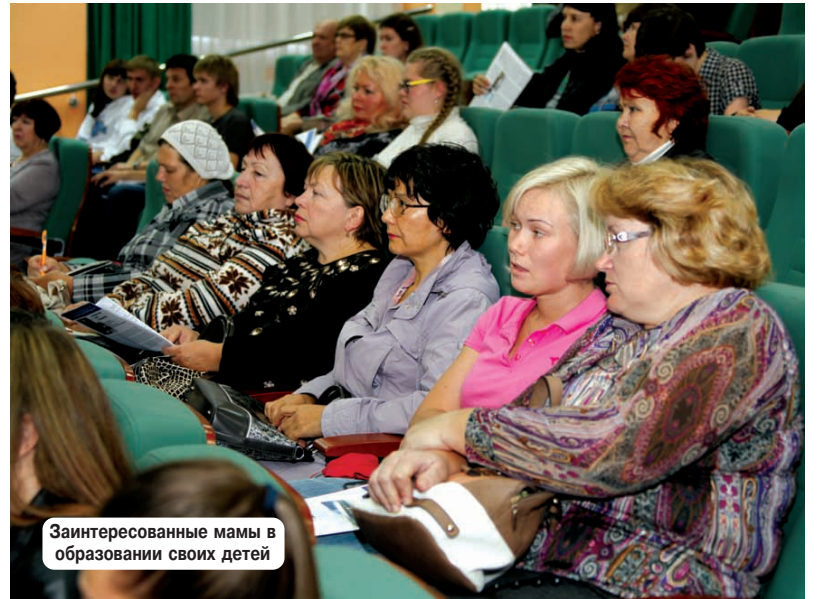
Заинтересованные мамы в образовании своих детей

бота, расширены возможности для комфортного обучения. Появились теплые переходы, дополнительный корпус, библиотека с большим фондом литературы и электронными учебными пособиями. В распоряжении студентов 100 современных лабораторий, 45 компьютерных классов, объединенных в локальную сеть. В планах - расширение университетских общежитий, создание спортивного комплекса, бассейна. БрГУ сотрудничает с крупнейшими промышленными компаниями, такими, как Иркутскэнерго и другими, что помогает студентам получить серьезную практику уже во время учебы. Главное - это мотивация к образованию. Ни кем быть, а каким быть - патриотом своей страны - России".