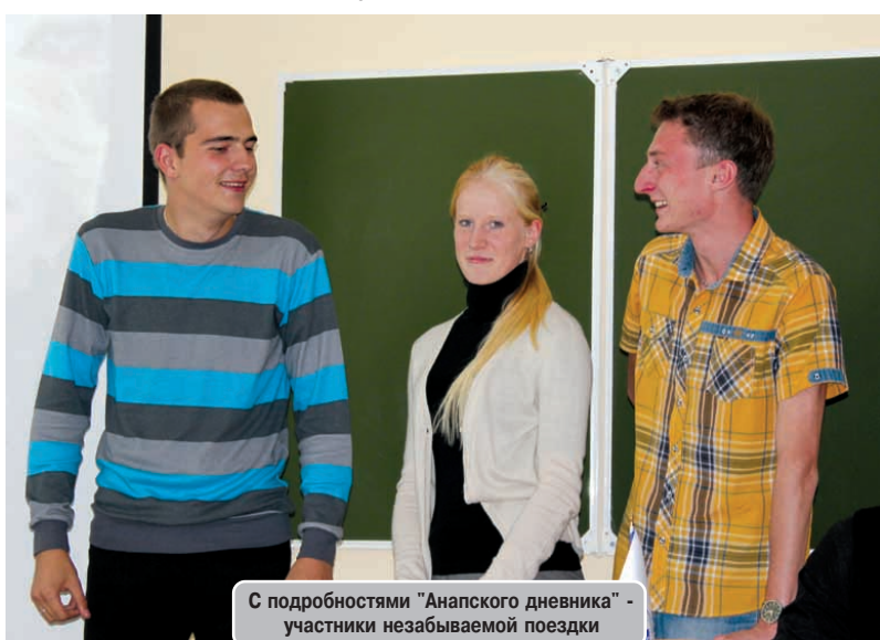
С подробностями "Анапского дневника" - участники незабываемой поездки