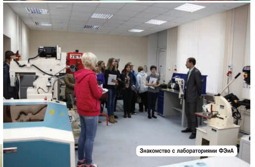
Знакомство с лабораториями ФЭИА