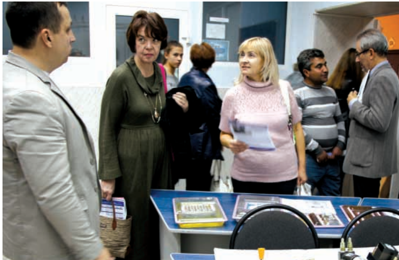
В одной из учебных аудиторий ЛПФ