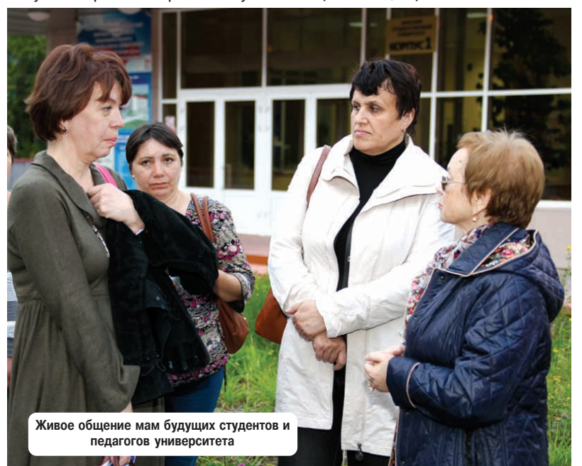
Живое общение мам будущих студентов и педагогов университета

Ректорат вуза выражает огромную благодарность структурным подразделениям университета, принявшим актив-