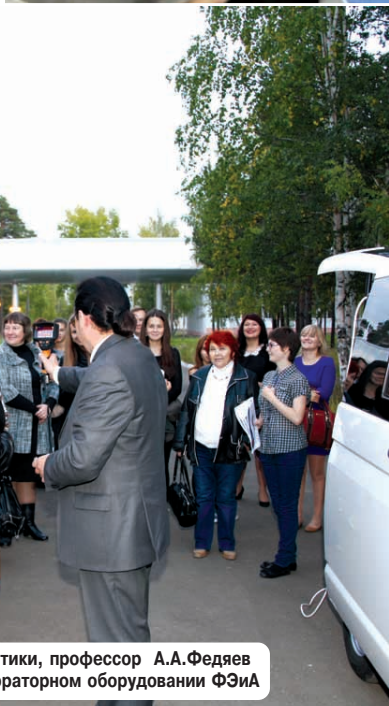
В лабораториях МФ