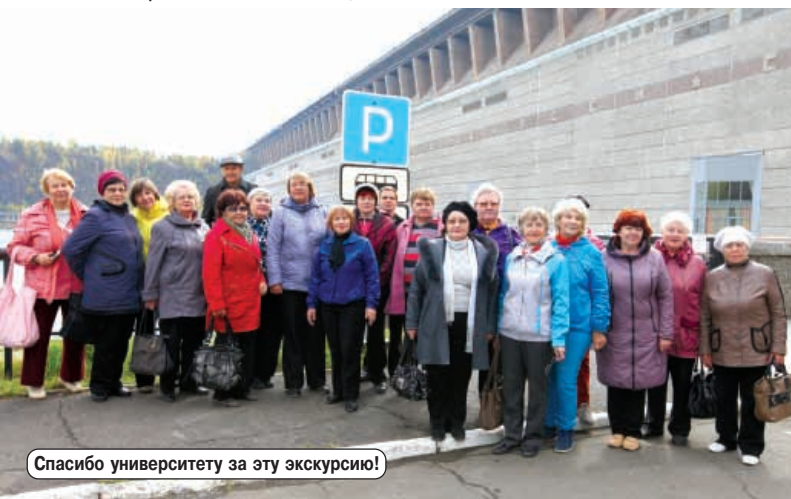
Спасибо университету за эту экскурсию!

21 сентября на стадионе "Труд" (пос. Падун) состоялся спортивный праздник, посвященный 60-летию Братскгэсстроя. После торжественного открытия, все участники мероприятия разошлись по своим «станциям». Зрители же заняли места на трибунах и замерли в ожидании ярких эмоций.