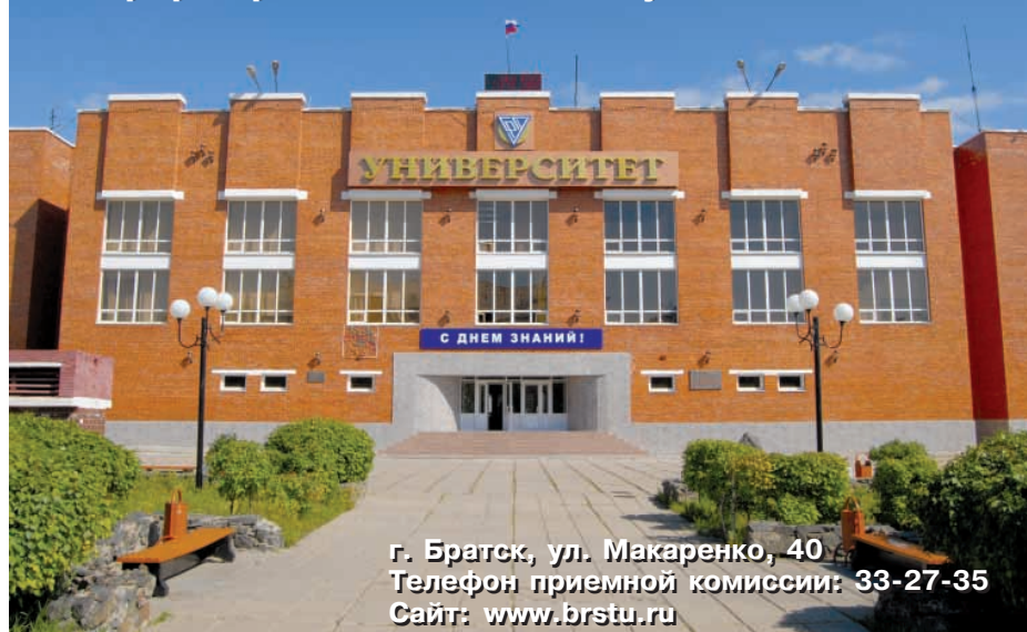
г. Братск, ул. Макаренко, 40 Телефон приемной комиссии: 33-27-35 Сайт: www.brstu.ru

В настоящее время успех зависит от трех составляющих: образованности, информированности и коммуникабельности