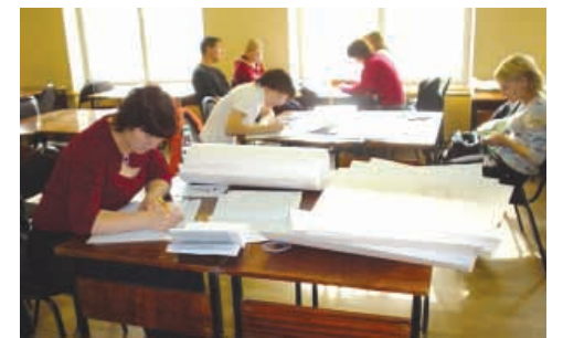
Студенты-заочники много времени проводят в читальных залах университета