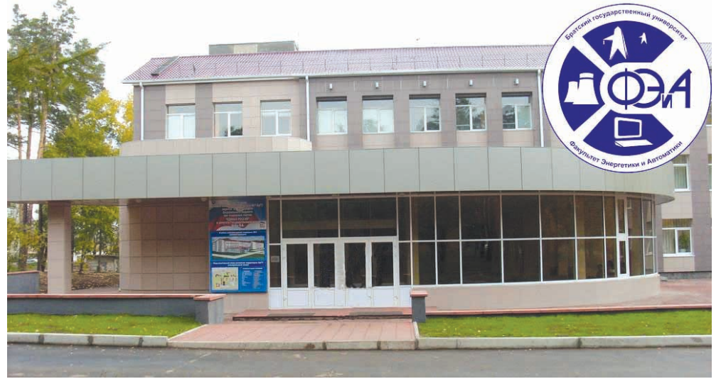
Учебно-лабораторный корпус №1, где учатся студенты ФЭиА

Творческие студенты ФЭиА ежегодно участвуют в фестивалях "Студенческая весна", "Зеленая волна", КВН, юморе "Бой гигантов", где уверенно занимают призовые места, а также участвуют в конкурсах "Мистер и Мисс БрГУ".