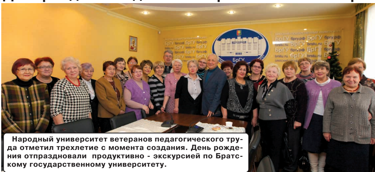
Народный университет ветеранов педагогического труда отметил трехлетие с момента создания. День рождения отпраздновали продуктивно - экскурсией по Братскому государственному университету.

Бывшие учителя, воспитатели детских садов и директора школ - все они, конечно же, имеют в своем активе диплом о высшем образовании. При этом "грызть гранит науки" им довелось кому 30, а кому и 50 лет назад. Именно поэтому слушатели народного университета в день рождения своей общественной организации захотели узнать, каков же сегодня современный классический вуз, отправившись в увлекательное путешествие по учебным корпусам БрГУ.