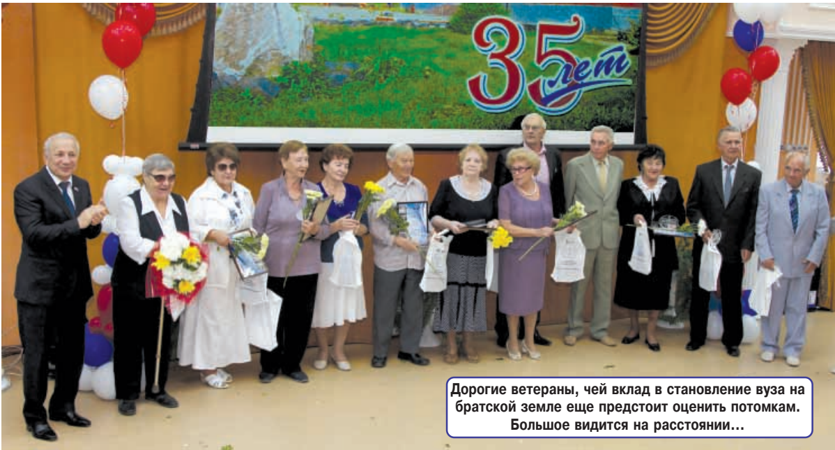
Дорогие ветераны, чей вклад в становление вуза на братской земле еще предстоит оценить потомкам. Большое видится на расстоянии...