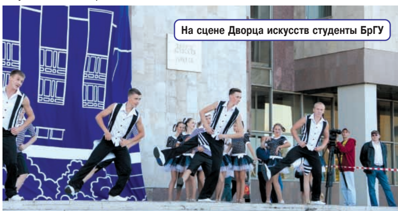
На сцене Дворца искусств студенты БрГУ