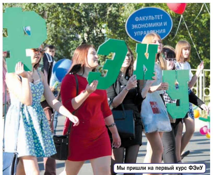
Мы пришли на первый курс ФЭУ