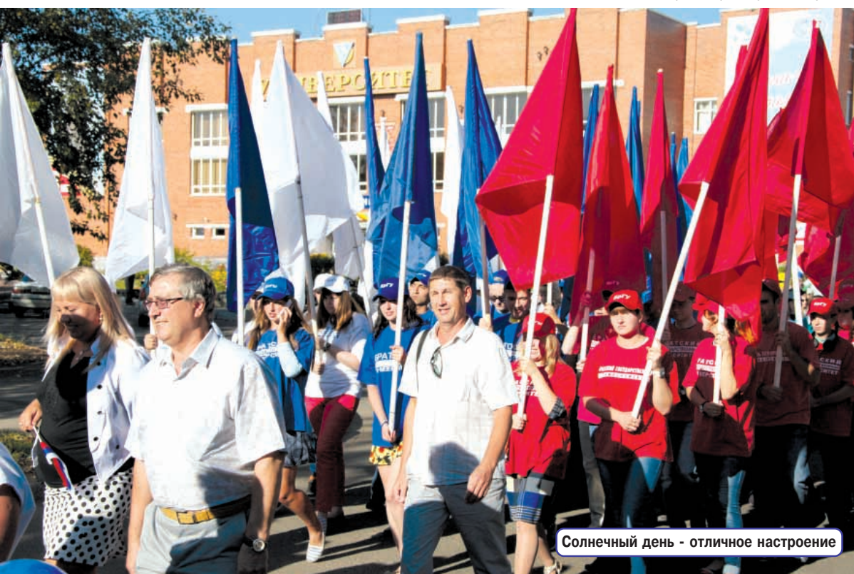
Солнечный день - отличное настроение

Все выступающие отметили уникальность нашего университета, его бесценные традиции, заложенные со времен строительства Братской ГЭС, огромный творческий потенциал, который