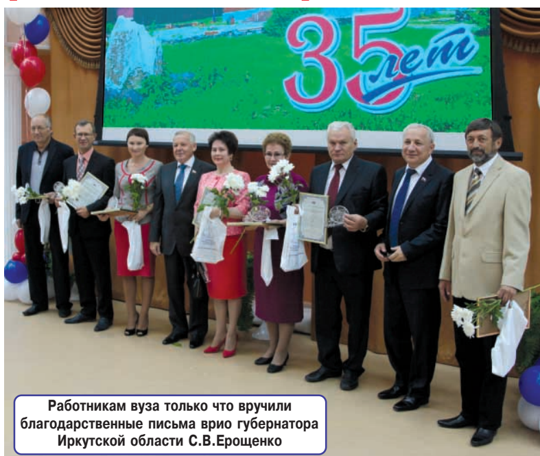
Работникам вуза только что вручили благодарственные письма врио губернатора Иркутской области С.В.Ерошенко

Приятным моментом поздравления стало юбилейное награждение работников и ветеранов вуза почетными грамотами и благодарственными письмами.