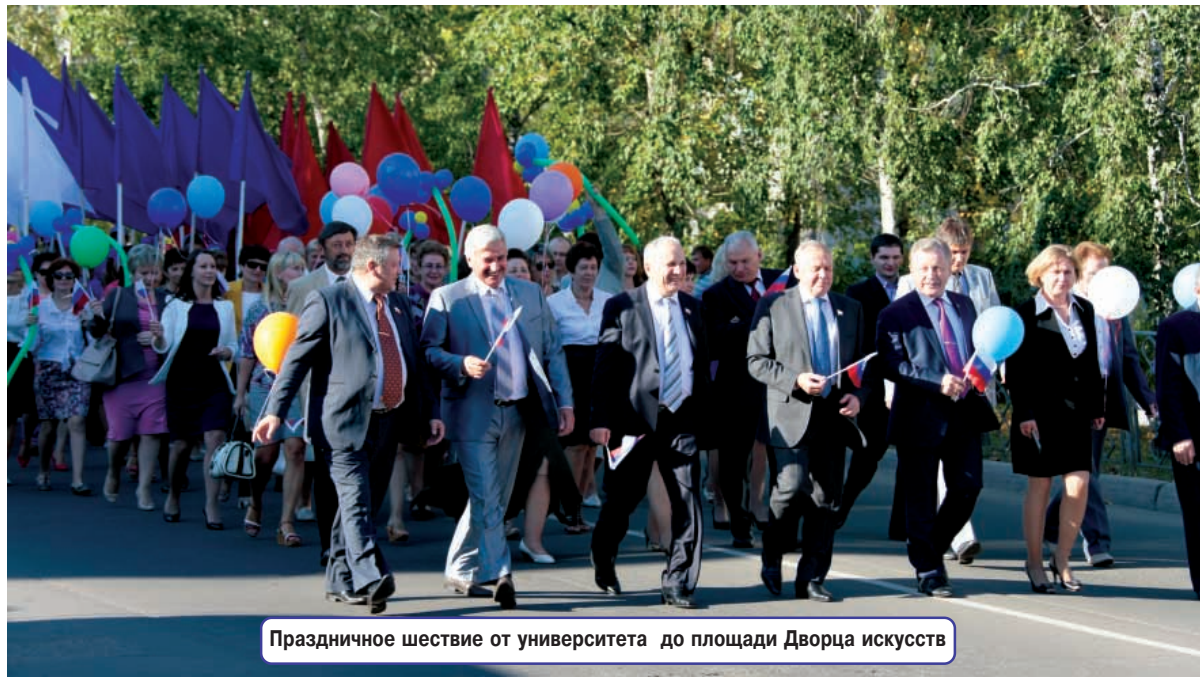
Праздничное шествие от университета до площади Дворца искусств

Большая группа преподавателей и сотрудников (30 человек) отмечена благодарственными письмами мэра и Думы города Братска. Особые слова поздравлений были адресованы в этот день ветеранам высшей школы. За многолетний добросовестный труд им вру-