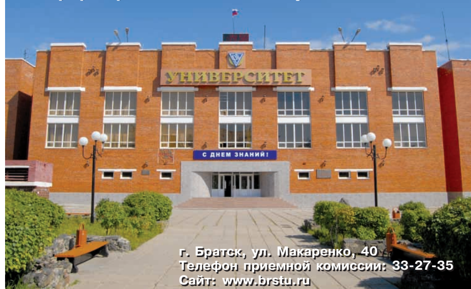
г. Братск, ул. Макаренко, 40 Телефон приемной комиссии: 33-27-35 Сайт: www.brstiu.ru

В настоящее время успех зависит от трех составляющих: образованности, информированности и коммуникабельности