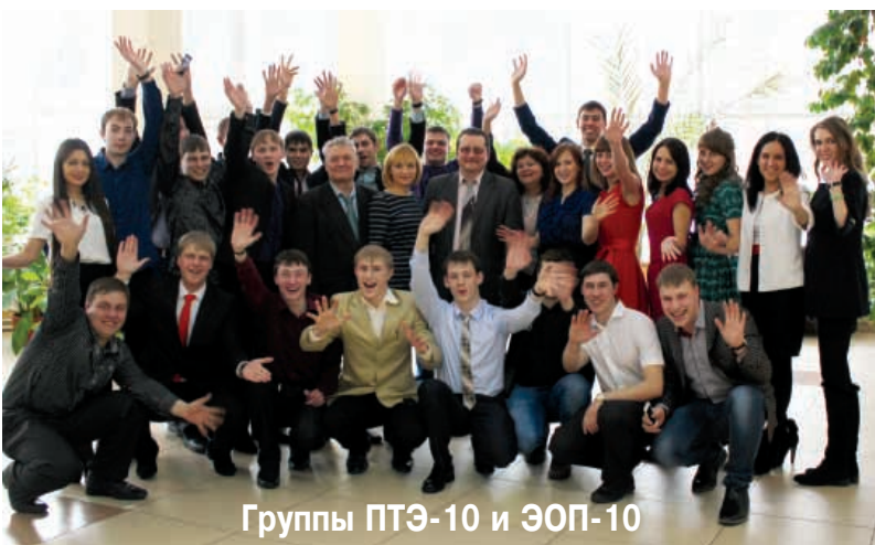
Группы ПТЭ-10 и ЭОП-10

Мы скажем просто, как умеем: "От всей души спасибо Вам!" За благородство мыслей Ваших! За мир Ваш светлый и большой! За то, что став немножко старше, Вы молодеете душой! За то, что в жизненных вопросах Вы - наша совесть, ум и честь! А если просто в плане тоста: За то, что Вы на свете есть!