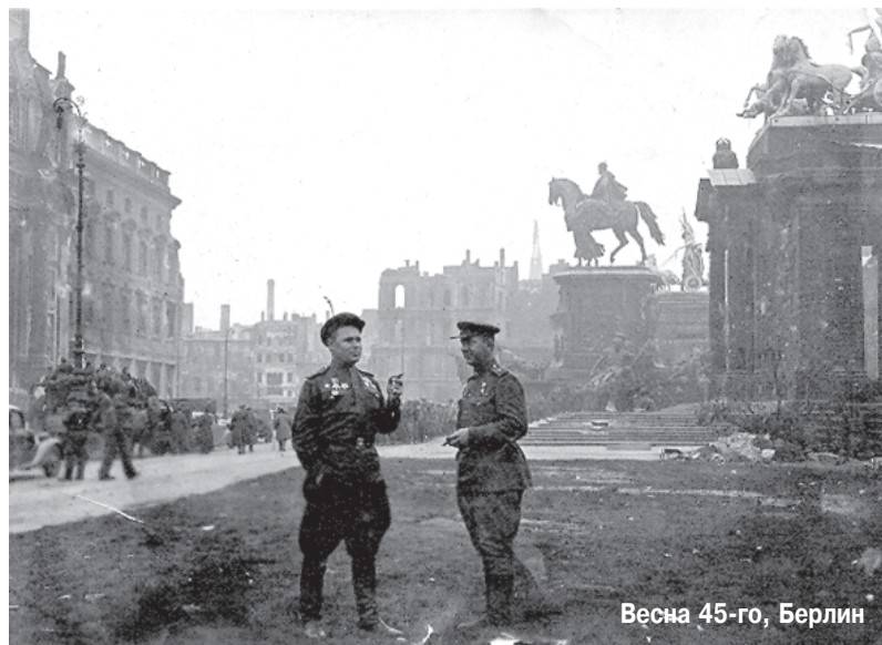
Весна 45-го, Берлин

К 70-летию Великой Победы Централизованная библиотечная система г. Братска проводит акцию "Память, которой не будет конца..." По ее итогам на сайте ЦБС будет создана виртуальная фотогалерея - хроника Великой Отечественной войны.