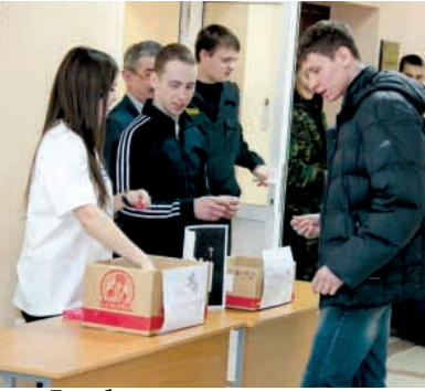
Пора бросать вредную привычку...

18 и 26 марта в учебно-лабораторных корпусах БрГУ проходила акция "Скажи сигаретам НЕТ!" Цель - в познавательной-игровой форме привлечь студентов к проблеме курения, призвать задуматься о своем здоровье и отказаться от курения.