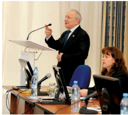
Отеческое слово ректора, обращенное к студенчеству