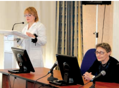
Всегда полезно послушать специалистов - медиков

Внимание окружающих была предложена своеобразная игра: "Меняем сигареты на конфеты!", где каждый желающий "курильщик" мог выбросить свои сигареты в специально предусмотренные для этого ящики и получить взамен конфеты. Акция сопровождалась выступлением певческих студенческих групп, исполнивших композиции на тему здорового образа жизни.