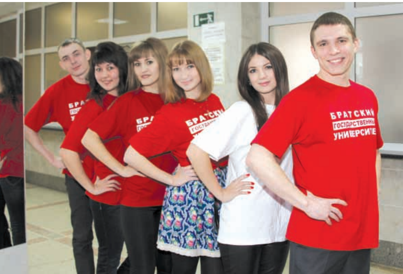
А мы не курим!

Внимание окружающих была предложена своеобразная игра: "Меняем сигареты на конфеты!", где каждый желающий "курильщик" мог выбросить свои сигареты в специально предусмотренные для этого ящики и получить взамен конфеты. Акция сопровождалась выступлением певческих студенческих групп, исполнивших композиции на тему здорового образа жизни.