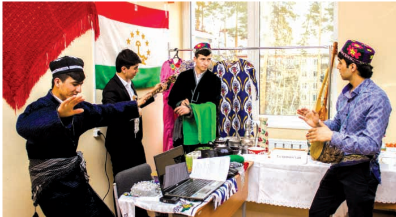
Выставка команды Таджикистана

Большое внимание в ходе работы "круглого стола" было уделено влиянию СМИ на формирование