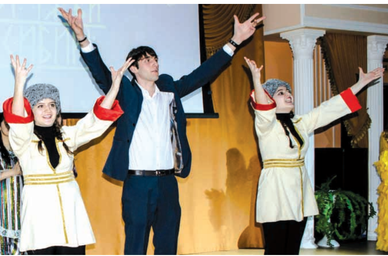
Выступление команды Грузии