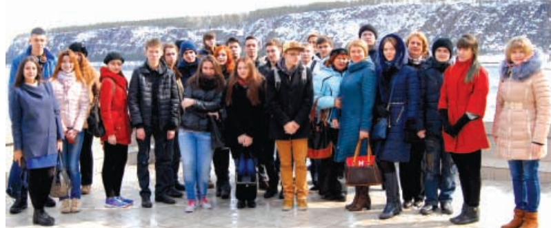
Многие школьники впервые увидели легендарную гидроэлектростанцию так близко...

22 марта состоялась традиционная экскурсия учащихся энергоклассов, обучающихся в нашем вузе в рамках реализации совместного проекта КУИЦ "Иркутскэнерго - БрГУ" и центра довузовской подготовки университета.