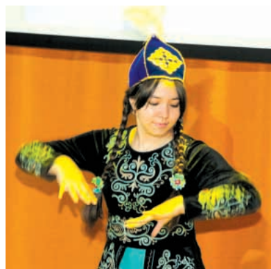
Творческий номер команды Кыргызстана