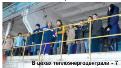
В цехах теплоэнергоцентрали - 7