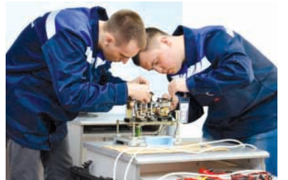
Лучший по профессии среди электромонтеров релейной защиты и автоматики

курс по охране труда и технике безопасности - сердечно-легочная реанимация на тренажере "Гоша-06" (12:11 в пользу ИрНИТУ), "Конкурс "Боулинг" (1102:1075 в пользу ИрНИТУ),