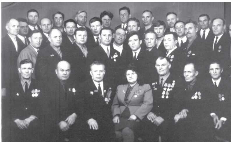
Ветераны Братскгэсстроя в 70-е годы

Много добрых дел сделано ветеранской организацией и ее руководителями за прошедшие 45 лет! Главное - ветераны Братска всегда чувствовали, что есть организация, которая может защитить их социальные права наряду с той большой патриотической работой среди молодежи, которую проводят люди старшего поколения, в том числе строители ГЭС и нашего легендарного Братска. Из поколения в поколение будут передаваться воспоминания о первых палатках, невероятных трудностях, первых победах над тайгой и гнусом, которые героически преодолевали первостроители. В кипучей жизни люди быстро набирались опыта, мужали и креп-