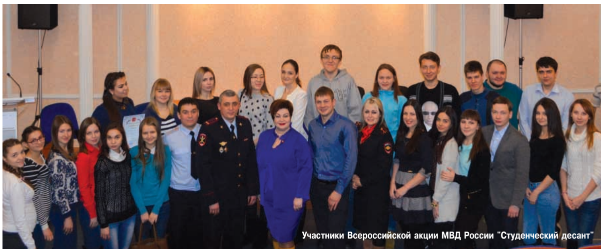
Участники Всероссийской акции МВД России "Студенческий десант"

В рамках Всероссийской акции Министерства внутренних дел РФ "Студенческий десант" 21 января в Братском государственном университете состоялась встреча сотрудников полиции со студентами-правоведами.