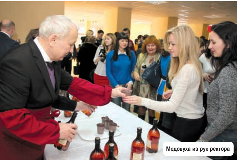
Медовуха из рук ректора

В завершение наш любимый ректор предложил студентам и преподавателям, всем гостям университета "отведать чарку медовухи". Студенты восприняли приглашение с воодушевлением! Медовуха - традиционный