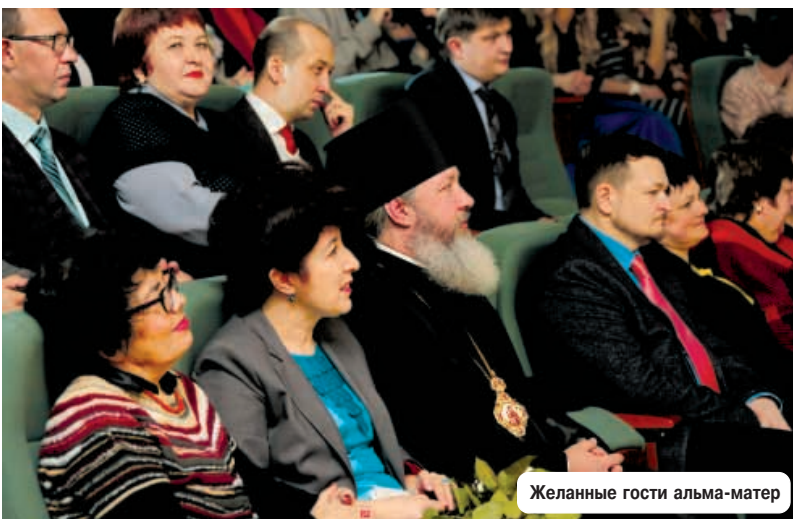
Желанные гости альма-матер