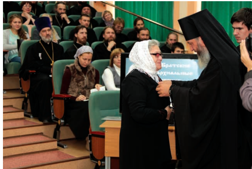
Вручение епархиальных медалей старостам сельских храмов Братского района

Волнующим моментом стал премьерный показ документального фильма, посвящённого памяти иркутской схимонахини Гавриилы (Безъязыковой), - "Невеста Христова". Автор замечательного фильма стала выступившая на пленарном засе-