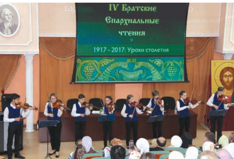
Ансамбль "Скрипичный ключ" из ОДШИ №3 г. Братска