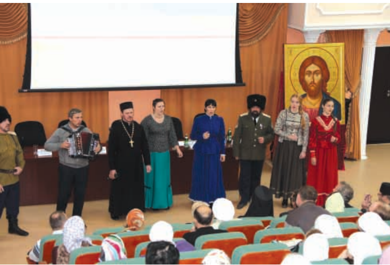
Выступление казахского ансамбля "Ладья"