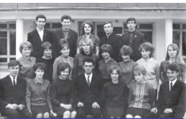
Выпускники 1965 года на крыльце 1-го учебного корпуса