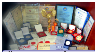
Многочисленные награды братского вуза

Пройдя сложный путь развития, БрГУ по праву заслужил высокое звание "университет". Миссия БрГУ - формирование единого научно-об-