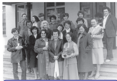
Студенты-заочники начала 80-х годов

По итогам недавнего мониторинга эффективности деятельности образовательных организаций высшего образования, который регулярно