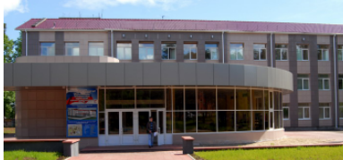
Вид 1-го корпуса в наши дни, где располагается факультет энергетики и автоматизации

С 2009 года велась кропотливая работа по созданию корпоративного учебно-исследовательского центра Иркутскэнерго - БрГУ, торже-